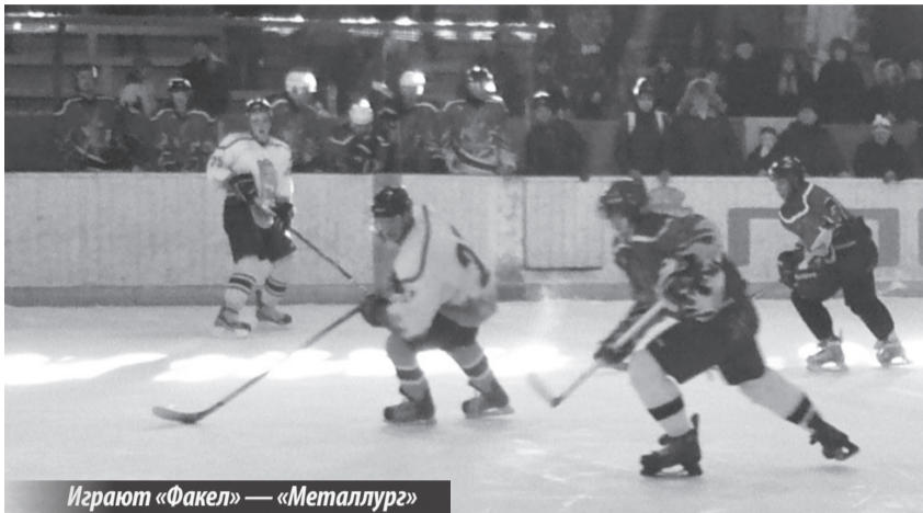
Играют «Факел» — «Металлург»

Первенство Свердловской области. Групповой этап