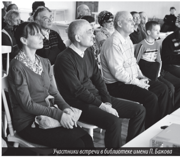
Участники встречи в библиотеке имени П. Бажова

С уважением О. КАРЯКИНА, В. СТРУГАНОВ