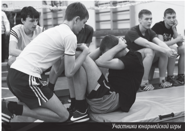
Участники юнармейской игры

НЕОБХОДИМО учить ребят быть патриотами, чтобы они знали свою историю, юноши были готовы защитить Родину. 3 марта на базе нижнетуринской СОШ №3 состоялся муниципальный конкурс — юнармейская игра «Патриот-Зарница», посвященная 70-летию Победы советского народа в Великой Отечественной войне. Участие в мероприятии приняли школы №№1, 2, 3, 7 и гимназия.