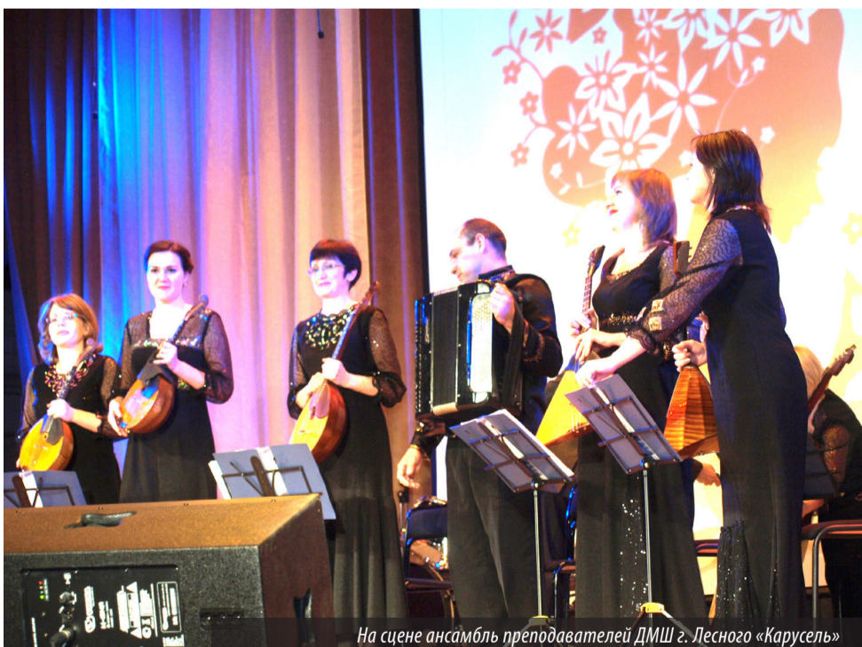
На сцене ансамбль преподавателей ДМШ г. Лесного «Карусель»

2015 год объявлен еще и Годом литературы, а женщина и творчество, литературное, в част-