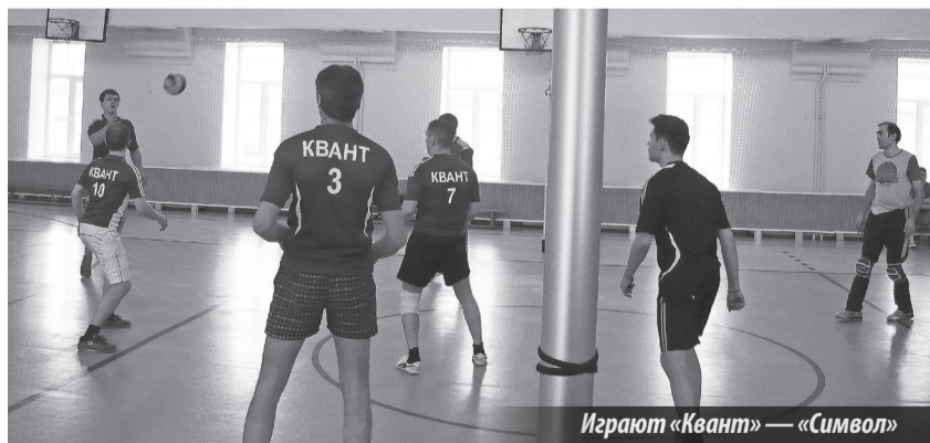
Играют «Квант» — «Символ»

Спартакиада трудовых коллективов «ЭХП». г. Лесной. Дом физкультуры. 07.03.2015 г.