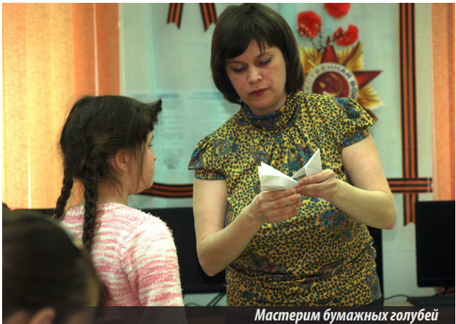
Мастерим бумажных голубей

Если вы об этом проекте еще не знаете, значит, вы, к великому сожалению, не были 25 марта в ЦГДБ имени Гайдара. Потому что в этот день в рамках Большой Книжкиной Недели детские библиотекари подробнейшим образом рассказывали юным читателям о новом проекте. О том, какие конкурсы будут проходить в его рамках, как принять участие в этих творческих состязаниях, о новых книгах, о войне. А еще учили ребят мастерить бумажных голубей, крохотных птиц Мира, показывали спектакль «Маленькие истории о большой войне». И еще 25 марта детские библиотекари рассказали ребятам очень интересный исторический факт. Оказывается, самый первый День детской книги был проведен в Москве 26 марта 1943 года! В разгар войны! На праздник специально, многие прямо с фронта, приехали детские писатели. А гостями праздника были полуголодные, бедно одетые дети, которые уходили домой с драгоценным по тем временам подарком — детской книжкой, отпечатанной на плохой серой бумаге.