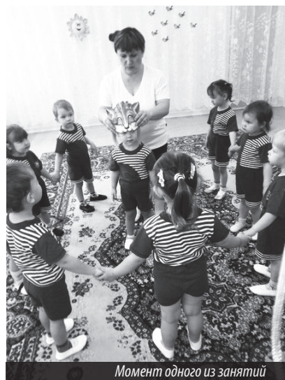
Момент одного из занятий

В этом году коллектив детского сада «Лилия» отметил 55 лет со дня своего открытия. На юбилейных торжествах по этому случаю присутствова-