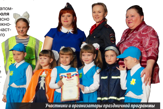
Участники и организаторы праздничной программы