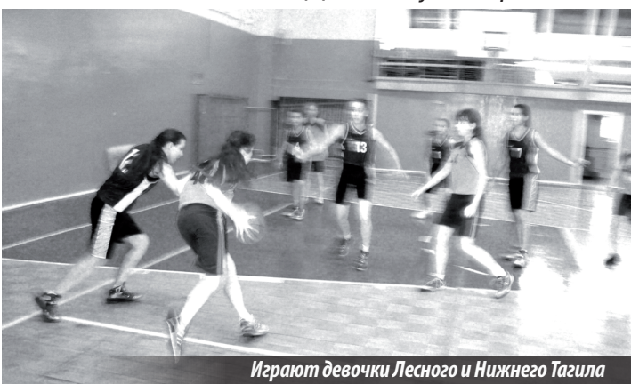
Играют девочки Лесного и Нижнего Тагила

Открытое первенство города «Весна в Лесном». Девушки 2001 г.р. и моложе. Юноши 2003 г.р. и моложе. Лесной. Зал ДЮСШ (ул. Мира, 30). 26–28.03.2015г.