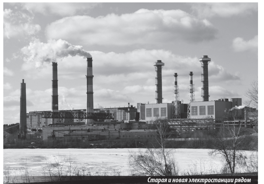
Старая и новая электростанции рядом