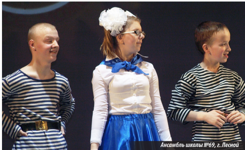
Ансамбль школы №69, г. Лесной

Уже ради той огромной радости, что испытывают дети в дни фестиваля, ради того необыкновенного света, каким горят их глаза, когда они выходят на сцену, эти фестивали, каким бы тяжелым ни был труд по их организации, надо проводить! И мудрые взрослые это, конечно, понимают. И потому будет и 20-й фестиваль, и дальше счет не прервется. Чтобы эти солнечные дети поняли: «Мы все можем!»