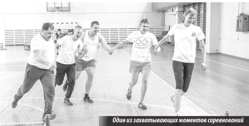
Один из захватывающих моментов соревнований

8 АПРЕЛЯ в СК «Юность» прошли «Веселые старты». Поучаствовать в них пришли не дети, как бывает обычно, а юноши и девушки. Было 4 команды по 5 человек в каждой, это: ТИК (Территориальная избирательная комиссия), МК (Молодежный комитет), «Историки» (преподаватели истории) и ЦДМК (Центр детских и молодежных клубов).