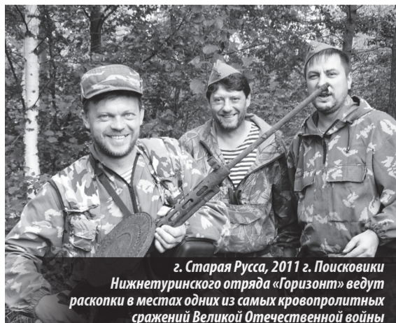
г. Старая Русса, 2011 г. Поисковики Нижнетуринского отряда «Горизонт» ведут раскопки в местах одних из самых кровопролитных сражений Великой Отечественной войны