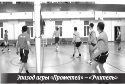
Эпизод игры «Прометей» — «Учитель»

Среди четырех поединков 11 апреля самым увлекательным оказался «Витязь» — «Коннект», по ходу которого волейболисты 440-го в/п вырвали победу на тай-брейке 2:1 (20:25, 25:18, 17:15). «Комета» переиграла далеко не слабый «Союз» 2:0 (25:22, 25:18). «Хайтек» в матче против «Спартак» более четко и точно сыграл в концовках обеих партий — 2:0 (25:21, 25:23). И только во встрече «Пилот» — «Технари» преимущество первых оказалось бесспорным 2:0 (25:9, 25:16).