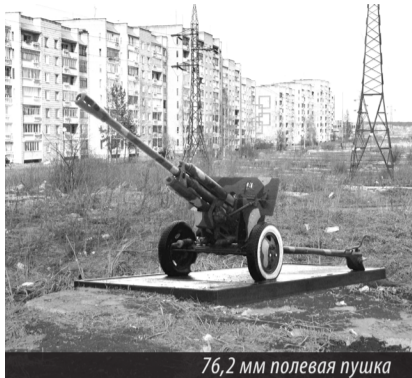
76,2 мм полевая пушка

НА ЭТИХ фотографиях (см. снимки) запечатлены боевая БРДМ-2 и полевая 76,2 мм пушка. На фоне «каскадников», чуть в стороне от магазина «Монетка». Конечно, это фотомонтаж, но так вполне могло бы быть. Место можно и поменять, установить подобные памятники в любой точке Нижней Туры. Думаю, они бы радовали глаз и жителей, и гостей города, ведь у многих россиян с ними были связаны определенные жизненные моменты.