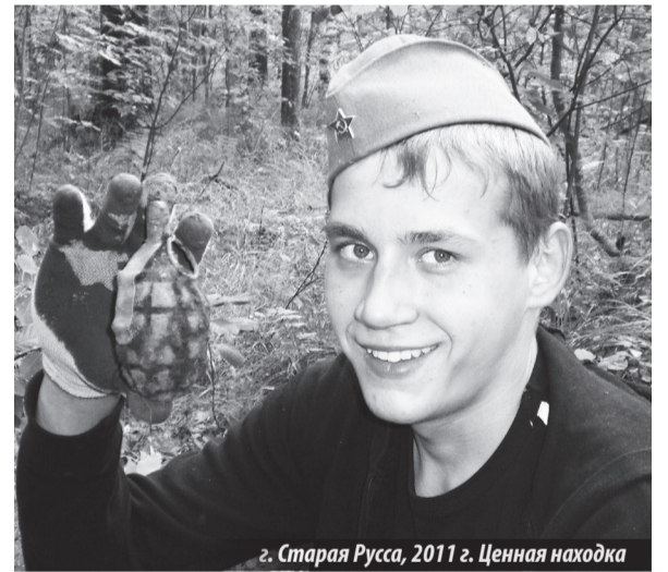
г. Старая Русса, 2011 г. Ценная находка

«Хочу вас проинформировать о том, что подписаны указы о присвоении звания ГВС городам Старая Русса, Гатчина, Петрозаводск, Грозный и Феодосия», — сообщил президент.