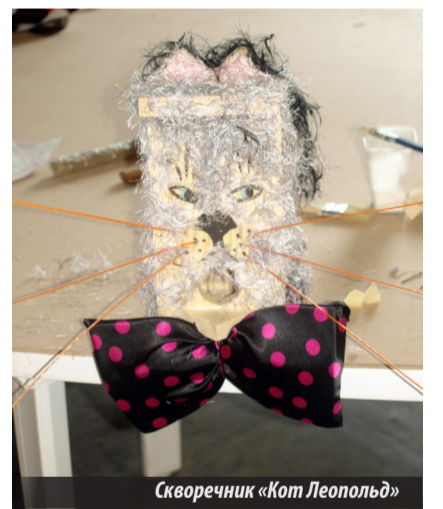
Скворечник «Кот Леопольд»

Все семьи отнеслись к заданию очень серьезно, каких только удивительных птичьих домиков не увидели мы, но и все презентации были очень яркими: песенными, стихотворными! А скворечники были — просто загляденье. Скворечник, посвященный 70-летию