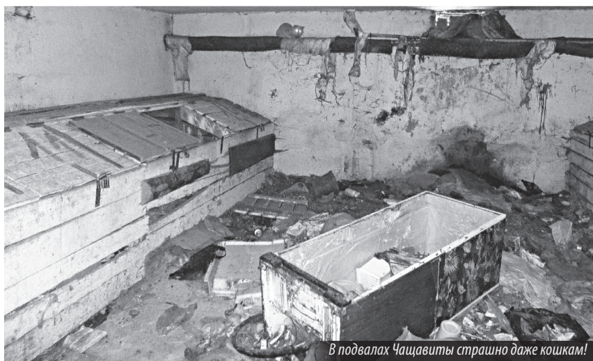
В подвалах Чащавиты страшно даже кошкам!