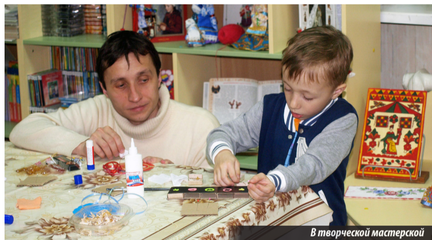
В творческой мастерской