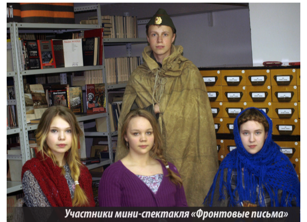
Участники мини-спектакля «Фронтовые письма»

«Бажовка» тоже в эту ночь была совершенно необычной: игры для взрослых и детей, песенные привалы, выставки моделей военной техники, литературно-музыкальные программы, народный пел, читал книги о войне, знакомился с многочисленными выставками, дети работали в мастер-классах, подводили итоги конкурсов, объявленных задолго до «Библионочи». Звучали пронзительные строки из солдатских писем, библиотекари рассказывали потрясающие истории из жизни фронтовиков и их семей, живших в Лесном, разыгрывались мини-спектакли, основой которых стали не придуманные, а подлинные истории. Даже кинологи со служебными собаками