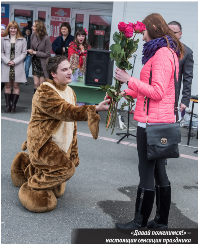
«Давай поженемся!» — настоящая сенсация праздника