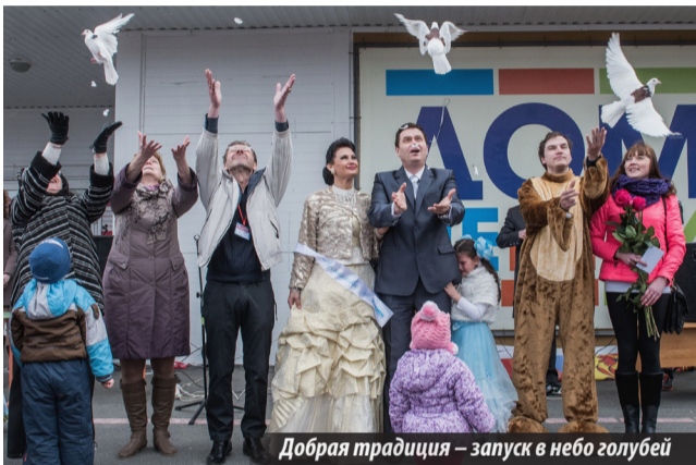
Добрая традиция – запуск в небо голубей