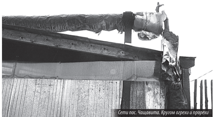
Сети пос. Чащавита. Кругом огухи и прорехи