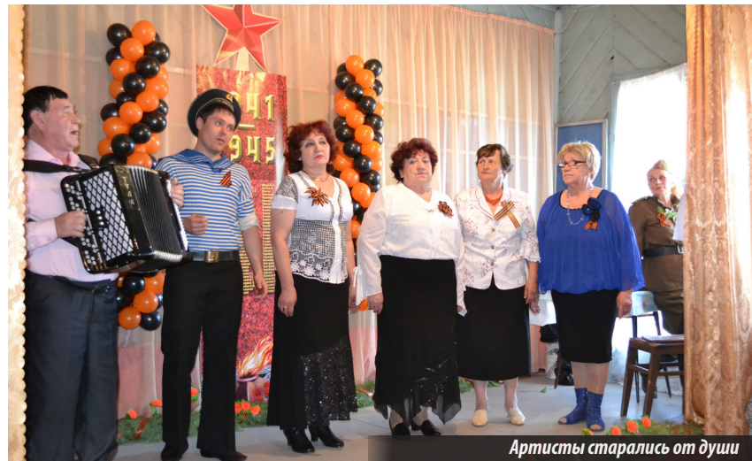
Артисты старались от души

В честь 70-летия Победы в Великой Отечественной войне