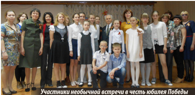
Участники необычной встречи в честь юбилея Победы

Также в канун Дня Победы в ЦГБ имени П. Бажова прошла встреча, посвященная 70-летию Победы, но из разряда совершенно необычных. Ее придумали и подготовили преподаватели иностранных языков школы №76. И разговор шел (а это был разговор бабушки и внучки) на трех языках — русском, английском и немецком. А еще звучали украинские песни! Вот так необычно, очень свежо говорили дети и взрослые о том, что мир нужен всем народам, вне зависимости от того, на каких языках они говорят и думают.