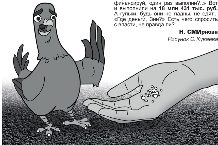
Рисунок С. Куваева