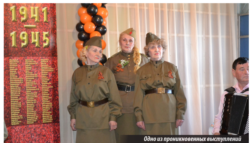
Одно из проникновенных выступлений

P.S. Но, как иногда, к сожалению, бывает, не обошлось без накладок. Накануне торжества клуб поселка Верхний Ис оставили без электричества. Возможно, такое решение имело под собой веские основания, но возникает вопрос: так ли необходимо было его принимать перед самым праздником? В итоге организаторам торжества все же удалось добиться подачи электроэнергии в сельский центр культуры, и праздник состоялся, но это прибавило забот его устроителям.