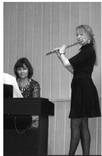
Музыкальное сопровождение от ДМШ г. Лесного

Т. САИТОВА, редактор отдела культуры, г. Лесной