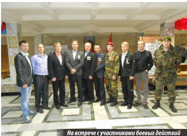
На встрече с участниками боевых действий