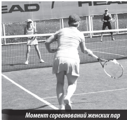
Момент соревнований женских пар

Турнир открытия сезона. Лесной. Теннисный корт. 29–31.05.2015 г.