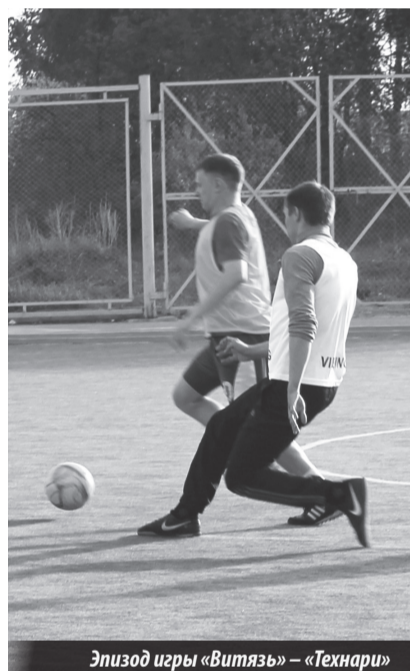
Эпизод игры «Витязь» – «Технари»