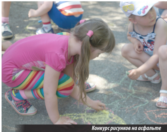
Конкурс рисунков на асфальте

ЛЕТО началось в понедельник. Сотрудники парка г. Лесного, люди, видимо, суеверные, решили начать его чуть раньше, в воскресенье. И в этот день, когда отдыхают все: и мамы, и папы, и бабушки, и дедушки, провели праздничную программу — «В гостях у Золотой рыбки».