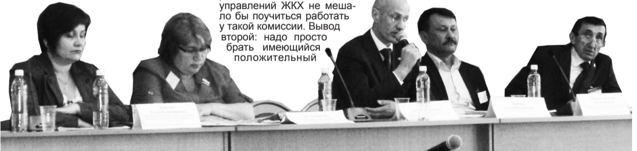
(Окончание на с. 4)

Л. Мельникова: Здесь надо четко понимать и различать сферу вопросов. Начнем с депутатов, и пусть они на меня не обижаются. Я бываю на заседаниях дум во всех городах. Мы с важным видом принимаем решения, беремся судить о работе руководителей организаций и учреждений города.