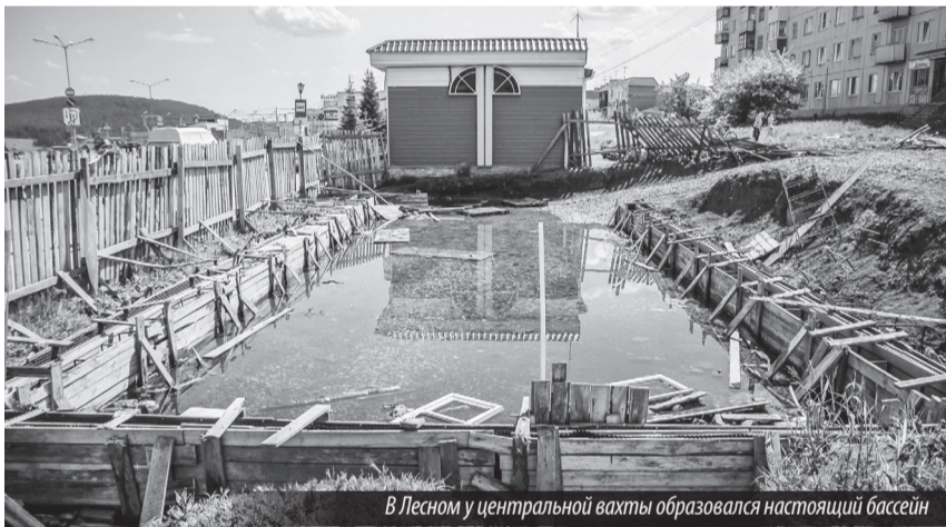
В Лесном у центральной вахты образовался настоящий бассейн

Почему она становится опасной для лесничан и гостей города?