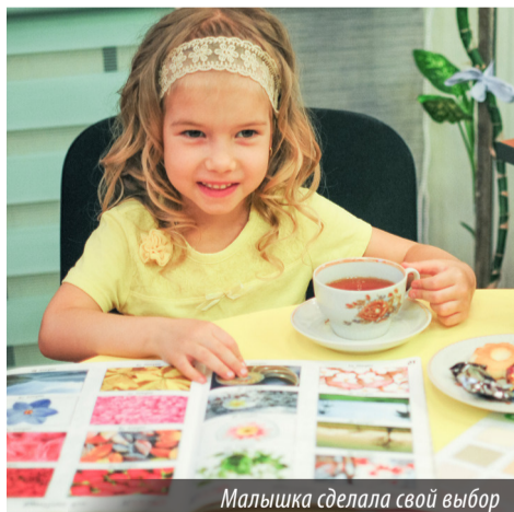
Малышка сделала свой выбор

10 лет. Сегодня «ART Дизайн» является единственным официальным представителем производственной компании «FRAN STUDIO» на Урале, выпускающей ПОДЛИННЫЕ полотна европейских производителей! Это говорит о том, что здесь предложат первосортные высококачественные, экологичные и пожаробезопасные полотна из Италии, Голландии, Эстонии, Франции, Германии, что подтверждено сертификатами. Самое главное, вам покажут не просто «красивые цветные бумажки», выписанные в рамочке на стенде с информации-