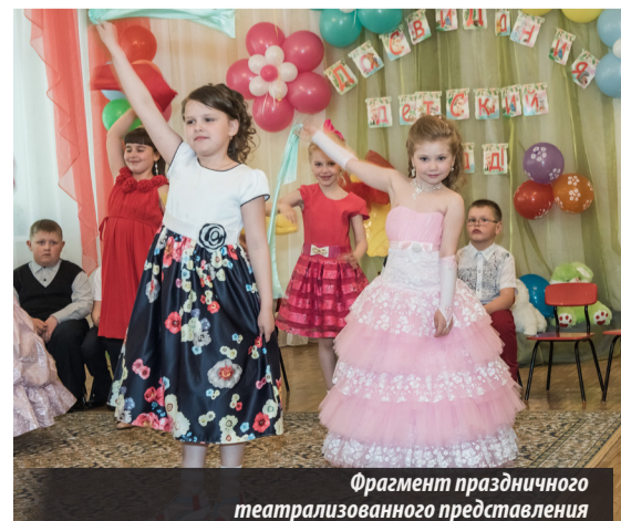
Фрагмент праздничного театрализованного представления