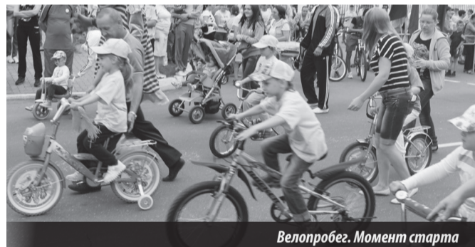
Велопробег. Момент старта

На перекрестке улицы Победы и Коммунистического проспекта возле памятника павшим в Великой Отечественной войне стартовал велопробег «Я люблю тебя жизнь». Здесь не было борьбы за быстрые секунды, главное — выйти на старт и проехать дистанцию от начала и до конца. Сначала отправились в путь самые маленькие, потом люди постарше и так вплоть до ветеранов спорта. Увиденное, что называется, радовало глаз.