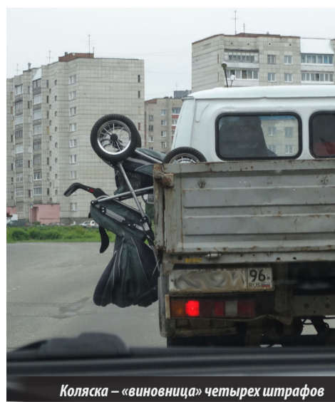
Коляска – «виновница» четырех штрафов