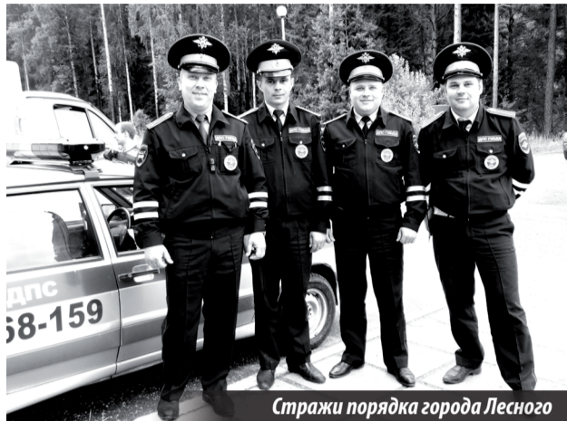
Стражи порядка города Лесного