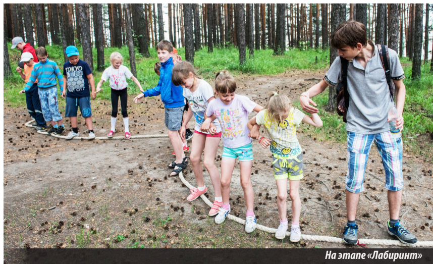
На этапе «Лабиринт»