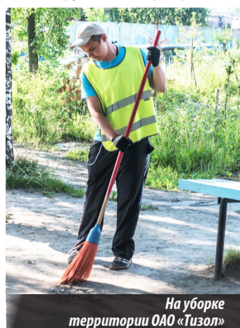
На уборке территории ОАО «Тизол»

К примеру, в школе №7 такой лагерь под названием «Горизонт» объединяет 20 учащихся школы. Как отметила начальник лагеря Ольга МУЖИКАНОВА, дети пришли сюда добровольно и трудятся с большим желанием. Работают они по 4 часа в день и за отработанное время получают небольшую заработную плату, чему, конечно, рады. 15 подростков трудоустроило ОАО «Тизол» (ген. директор М.Г. МАНСУРОВ) подсобными рабочими, они убирают заводскую территорию и сажают цветы. Еще 5 человек заняты на пришкольном участке, где приводят в порядок цветочные клумбы. Кроме того, двое подростков из бригады, которая трудится на пришкольном участке, помогают нашим ветеранам, ежедневно приносят им родниковую воду. Руководитель лагеря подчеркнула, что трудовой лагерь при школе — очень полезное дело. Ведь дети здесь не только зарабатывают деньги, но и учатся трудиться, общаются друг с другом. На днях мне удалось посетить этот лагерь, и было видно, что подросткам нравится здесь находиться, что на работу они ходят с удовольствием.