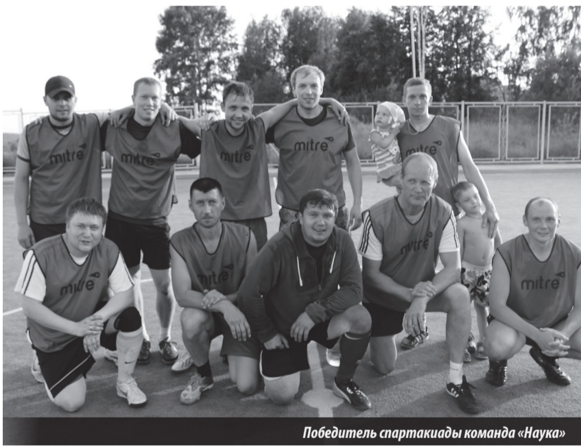
Победитель спартакиады команда «Наука»