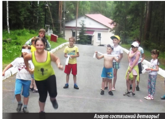
Азарт состязаний детворы!