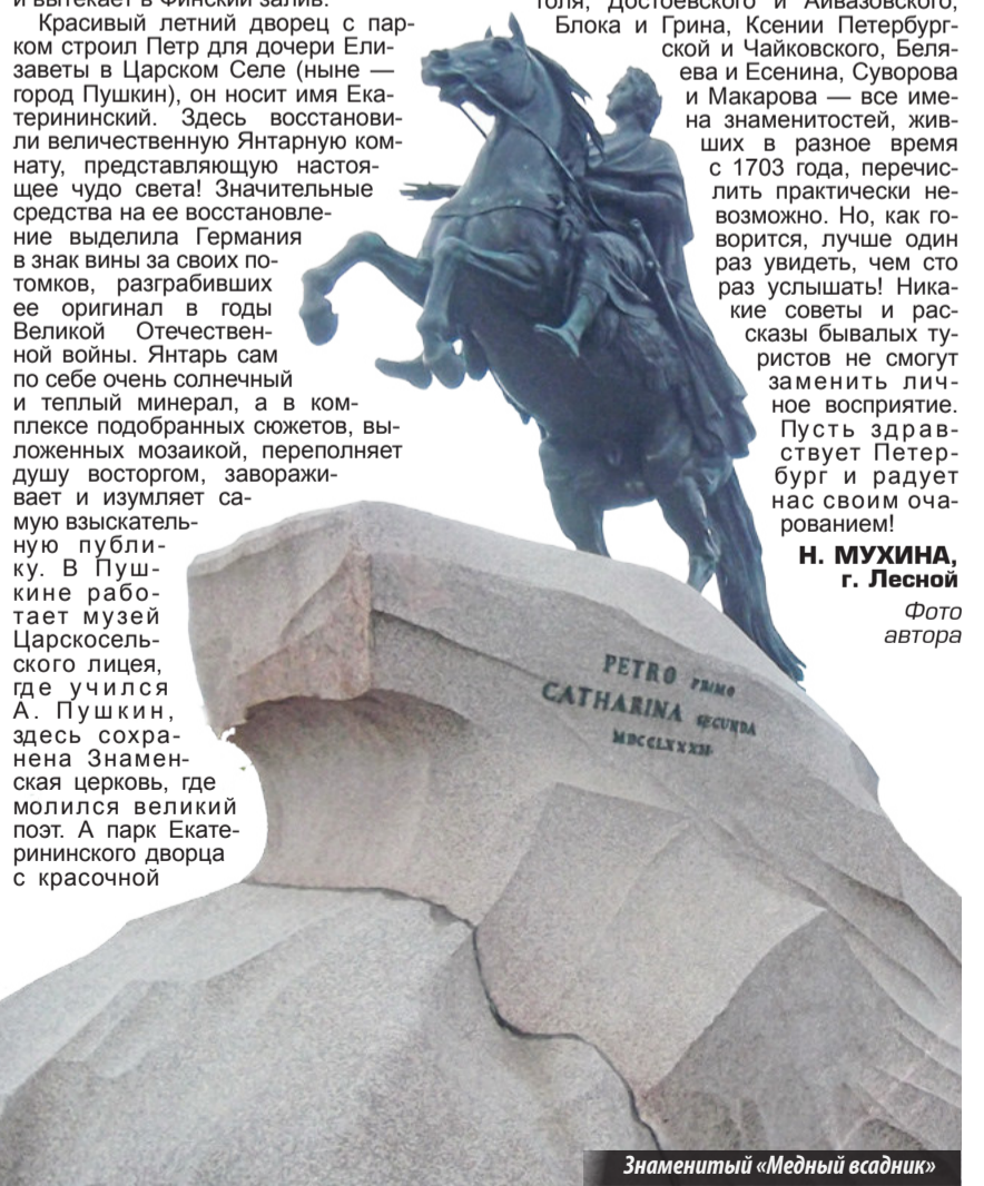
Знаменитый «Медный всадник»