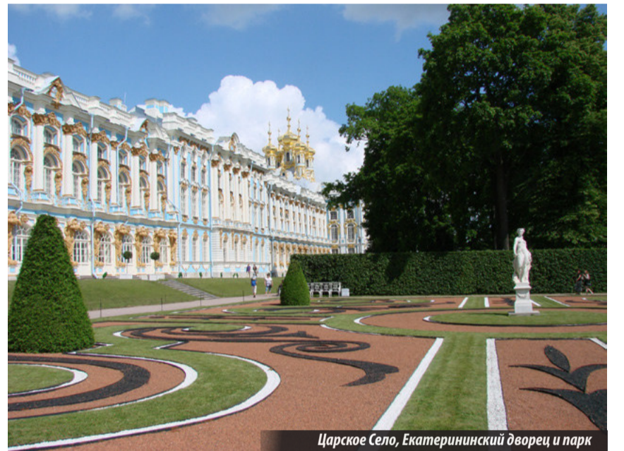
Царское Село, Екатерининский дворец и парк

«Жизнь измеряется не числом вдохов и выдохов, а моментами, когда захватывает дух!»