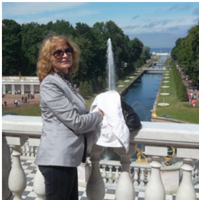
Финский залив просматривается на горизонте! Петергоф особенно хорош в солнечную погоду!

ЭТО мудрое изречение сопровождает меня всю жизнь. Моя семья любит путешествовать по городам и весям, любоваться природой, познавать каждый раз что-то новое, интересные события, факты — все это вдохновляет, наполняет положительной энергетикой и делает жизнь увлекательной.