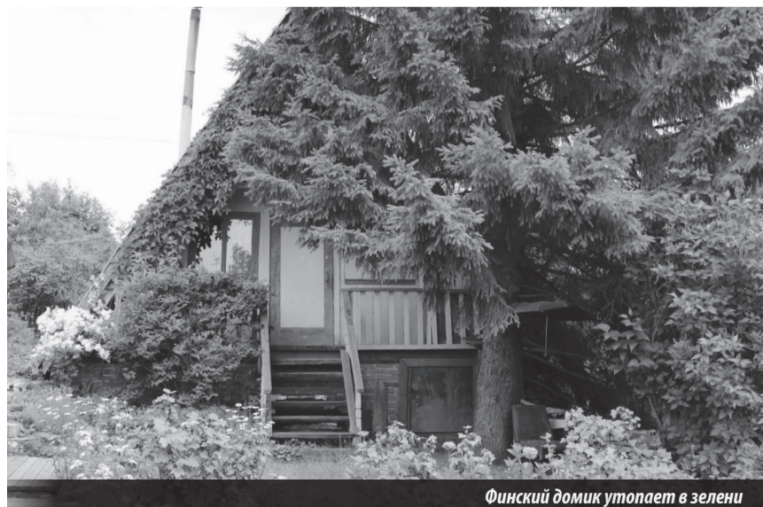
Финский домик утопает в зелени