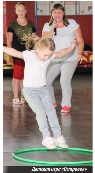
Детская игра «Островок»