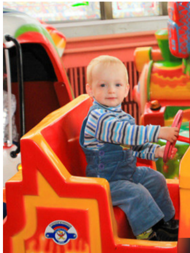
Аттракционы — радость для малышей

нашей необъятной страны, а нуждающимся детям было передано более 200 тысяч билетов.