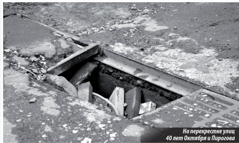
На перекрестке улиц 40 лет Октября и Пирогова