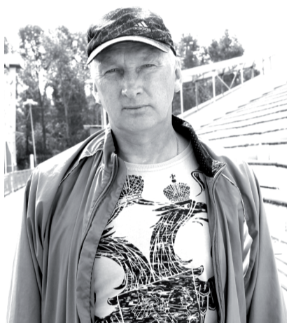
на базе в Новогорске, 24 августа — вылет в Пекин, 27-го — квалификационный отбор, 28-го — финал.

— Вы тоже отправитесь на чемпионат мира?