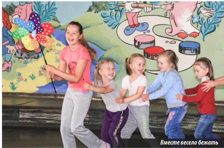
Вместе весело бегать

В ходе акции гости парков аттракционов, приобретая билеты для своих детей, могут купить еще один или несколько абонементов для деток, которые по разным жизненным обстоятельствам не имеют возможности посетить развлекательные учреждения. В каждом парке оборудована специальная «солнечная копилка», в которую желающие вносят свой вклад в виде билетов на аттракционы. За годы существования в проекте поучаствовало более 150 парков из 80 городов