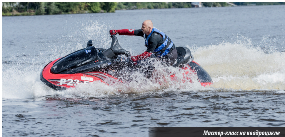
Мастер-класс на квадроцикле

Отличились и водномоторники, показали настоящий мастер-класс, устроив у берега пруда на гидроциклах настоящее аква-шоу! Я и не ожидал, что на них можно вытворять такие кульбиты! Желающие гоняли на водных