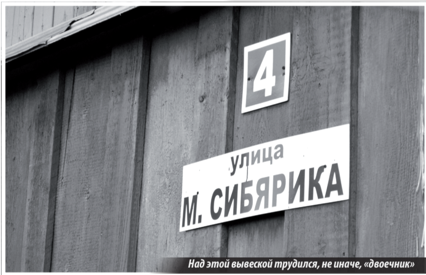
Над этой вывеской трудился, не иначе, «двоечник»

для испытания автомобильной подвески! Вторая скорость — максимум для автомобиля, иначе все — или ремонт техники, или лечение мозга от сотрясения. Даже непонятно, какое здесь было покрытие раньше, в те времена, когда за улицей службы благоустройства города все-таки как-то следили. Ямы глубокие, края острые, в ямах вода, грязь... Без особой нужды лучше здесь не ездить.