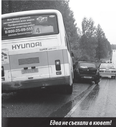
Едва не съехали в кювет!