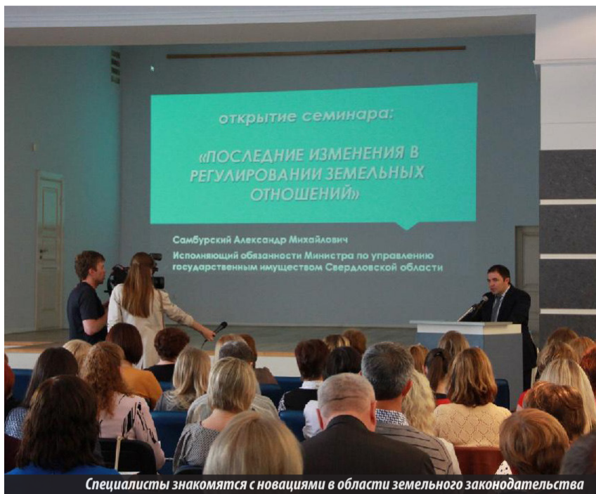
Специалисты знакомятся с новациями в области земельного законодательства

О новом порядке формирования и предоставления земельных участков