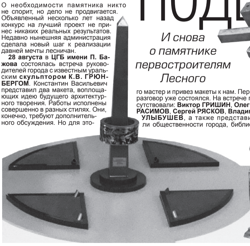
К. Грюнберг. Эскизные варианты памятников