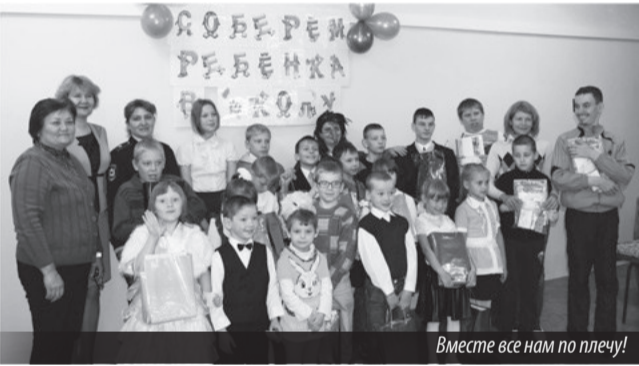
Вместе все нам по плечу!

О том, как полицейские поздравили детей с началом учебного года