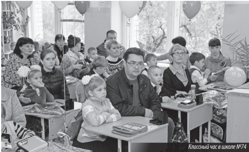
Классный час в школе №74

Напомним, в течение всего лета в дошкольных и общеобразовательных структурах активно велись работы по обнов-