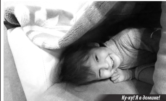
Ку-ку! Я в домике!

Но есть в этой невеселой погодной аномалии и свои плюсы. Да-да! Задумайтесь, что может быть чудесней, чем выходные, проведенные всей семьей! Заварить вкусный чай с шиповником, испечь булочки с корицей, забраться с ногами под теплый пушистый плед и посмотреть интересный фильм. Или построить с детьми «настоящий дом» из диванных подушек и одеял, а устроившись поудобней в новом «убежище», почитать захватывающую книгу про пиратов и принцесс. Кстати, почему бы не взять в руки краски и не попросить деток нарисовать что-нибудь солнечное, теплое, радостное, и при помощи ярких картинок, развешанных по всей квартире, не создать в ней собственное маленькое лето?