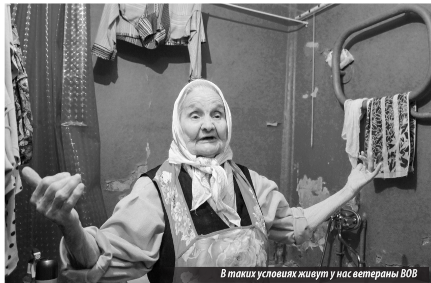
В таких условиях живут у нас ветераны ВОВ