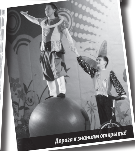
Дорога к знаниям открыта!