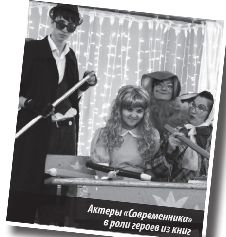
Актеры «Современника» в роли героев из книги