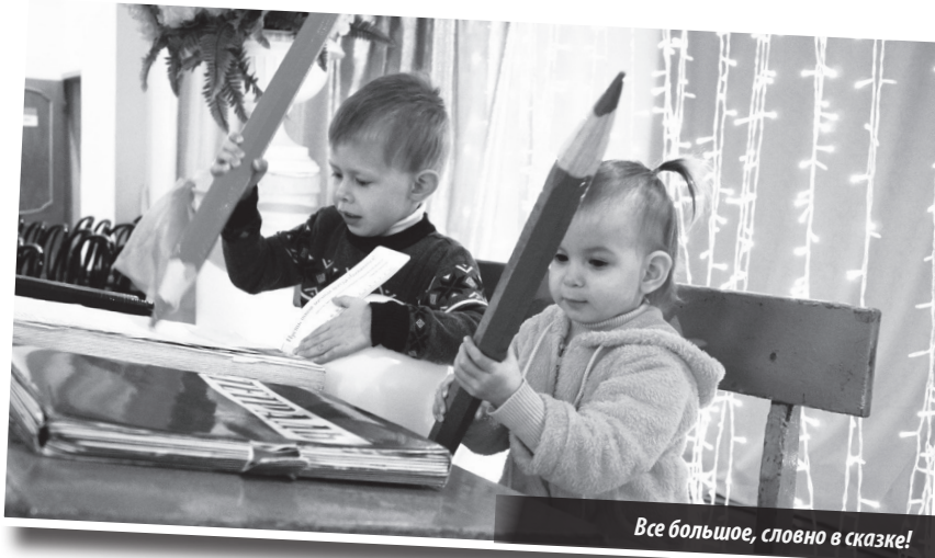
Все большое, словно в сказке!