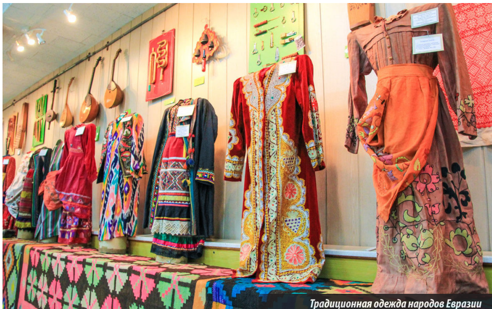
Традиционная одежда народов Евразии