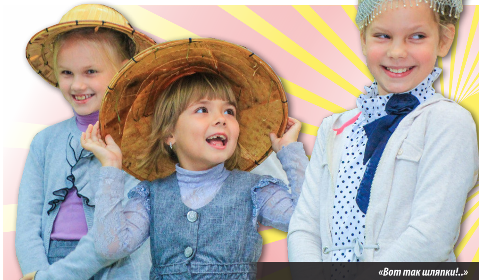
«Вот так шляпки!..»

Сначала неординарный автор ловко заговорил скороговорками на разных языках — языках народов, чьи инструменты украшали вы-