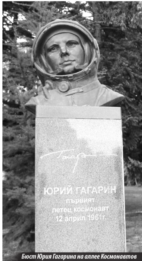
Бюст Юрия Гагарина на аллее Космонавтов

Если мы повернем в Приморский парк по улице Михаила Колони, то пройдем мимо здания «Фестивален и конгресен център» (построен в 1986 г. как филиал Национального Дворца культуры в Софии). В нем 11 залов вместимостью от 40 до 1 000 мест, 3 ресторана и 5 кафе. Он является центром организации фестиваля болгарского кино «Золотая роза», фестиваля европейской кинопродукции, международных музыкального, театрального и хорового фестивалей «Варненское лето». А рядом с ним — централь-