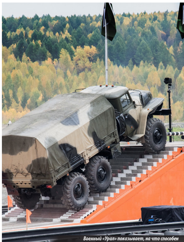
Военный «Урал» показывает, на что способен