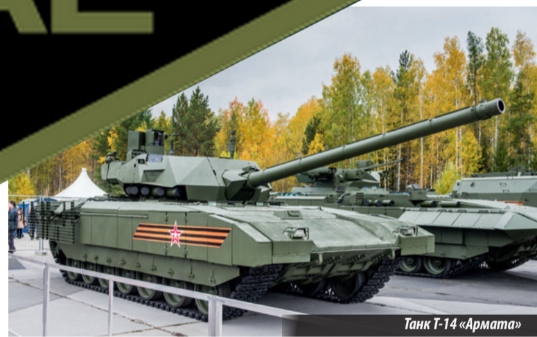
Танк Т-14 «Армата»

R ussia Arms Expo проводится с 1999 года раз в два года на полигоне Старатель Нижнетагильского института испытания металлов. RAE по праву входит в число ведущих мировых выставок.