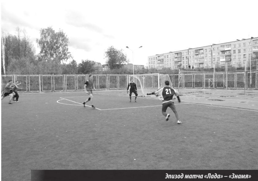
Эпизод матча «Лада» — «Знамя»