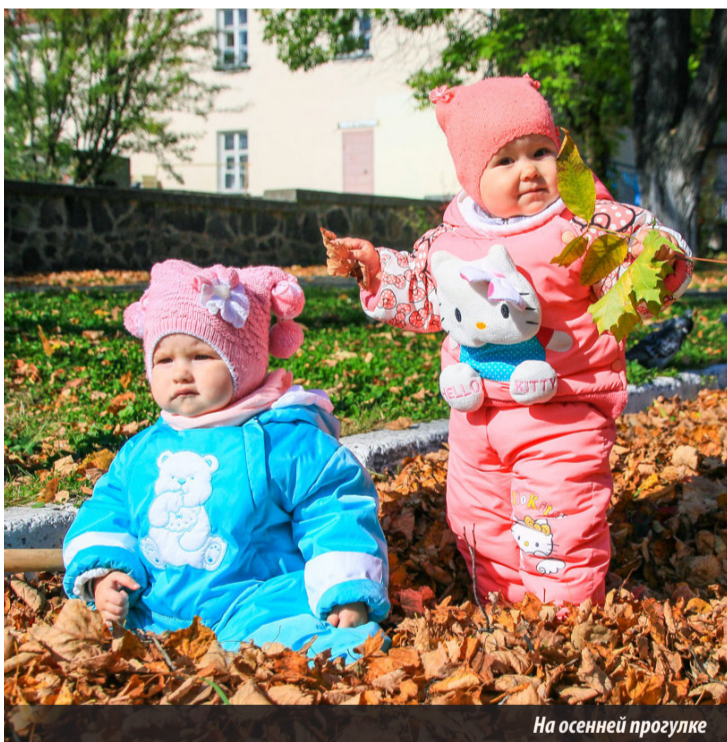
На осенней прогулке