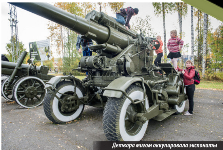
Детвора мигром оккупировала экспонаты