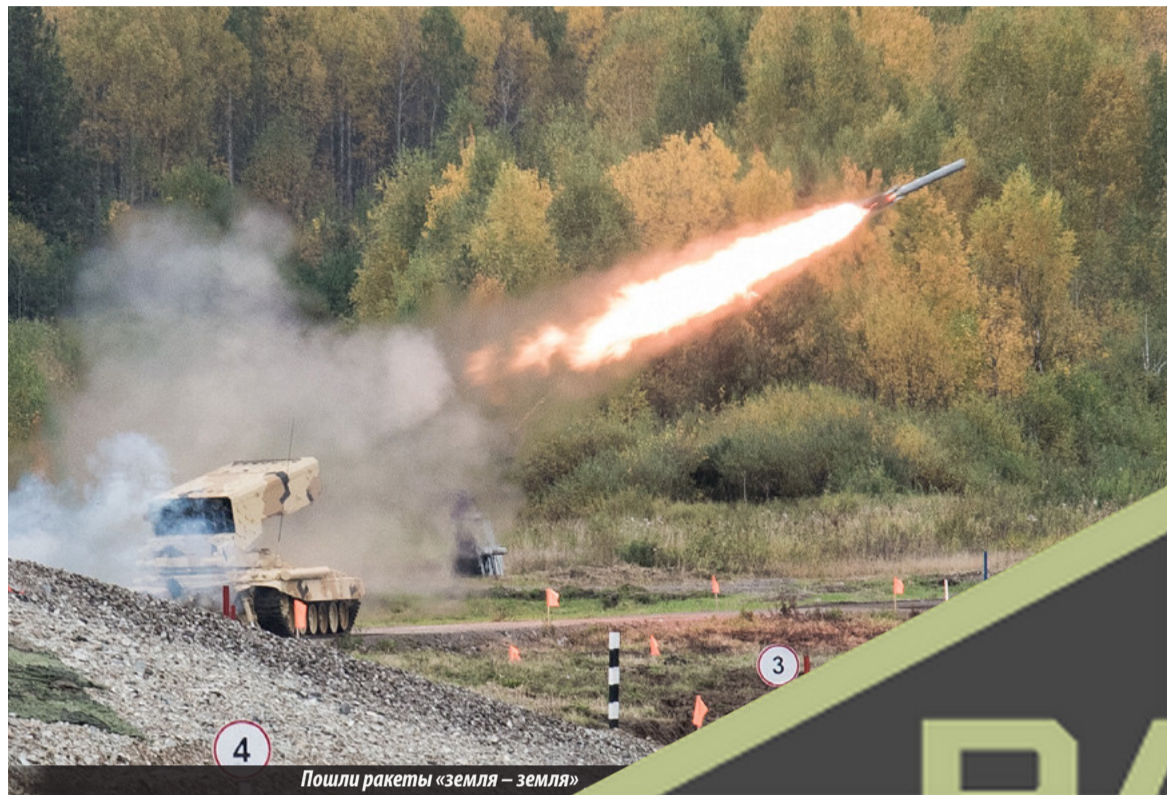
Пошли ракеты «земля – земля»