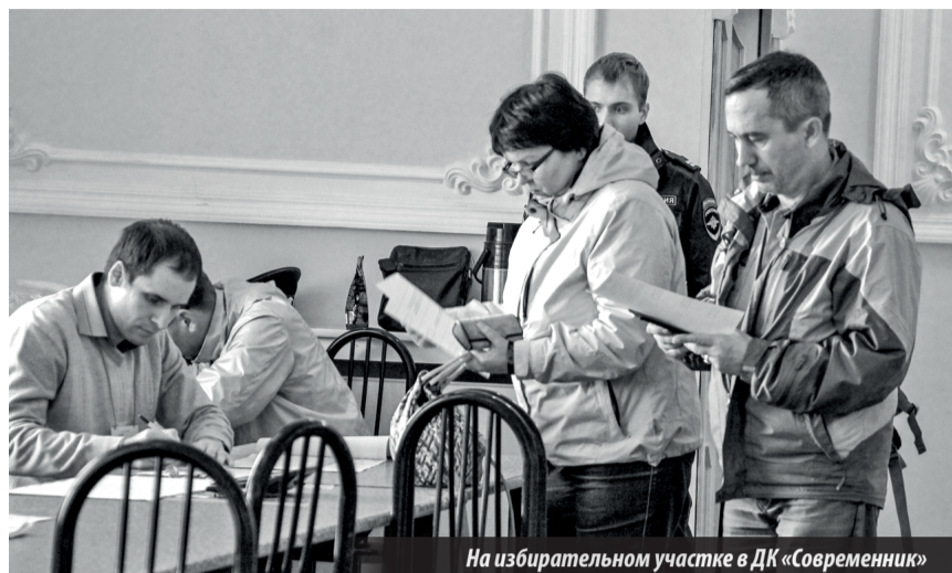
На избирательном участке в ДК «Современник»

На сайте http://www.gibdd.ru или https://www.gosuslugi.ru , нужно пройти семь шагов. Первый шаг — «согласие». Знакомимся с порядком предоставления услуги, ставим галочку, нажимаем «далее» (нажимаем «далее» каждый раз для перехода к следующему шагу). Второй шаг «выбор варианта оказания услуги». Выбираем регион, тип услуги (постановка, снятие и т.д.), ниже выбираем предложенные варианты. Тре-