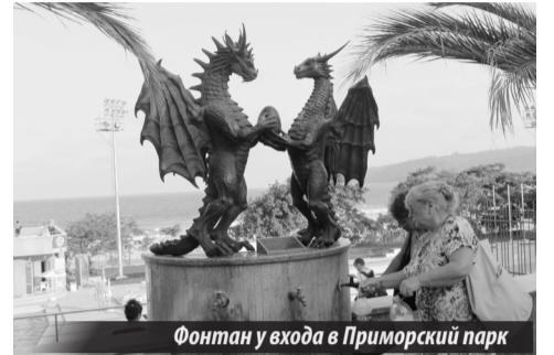
Фонтан у входа в Приморский парк

На восточной оконечности Приморского парка, минуя детский городок, летний театр и зоопарк (1961 г., более 70 видов животных, более 350 особей), можно попасть в дельфинарий (построен в 1984 г.) — единственный в странах Балканского полуострова (1134 места). Программа, длящаяся 40 минут, действительно очень интересна: эти морские млекопитающие невероятно сообразительны. Пояснения трюков на нескольких языках, в том числе на нашем родном.