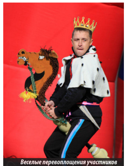
Веселые перевоплощения участников