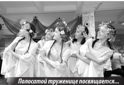
Полосатой труженице посвящается...

В последние десятилетия из-за применения химикатов, сокращения числа медоносов, количество пчел в мире резко сократилось, о чем свидетельствуют зарубежные эксперты. Цель праздника — содействовать просвещению людей о том, что пчелы нуждаются в нашей охране.