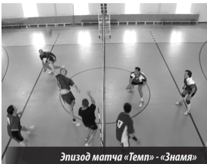
Эпизод матча «Темп» - «Знамя»

Уже первый матч 14 сентября «Наука» — «Мотор» сложился для фаворитов — волейболистов МСП-121 — не просто: игроки цеха 013 предстали более сыгранным коллективом, сумели взять одну партию и были близки к тому, чтобы «зацепить» еще одну, но чуда не случилось — 3:1 (25:12, 22:25, 25:10, 25:23) в пользу «Науки».