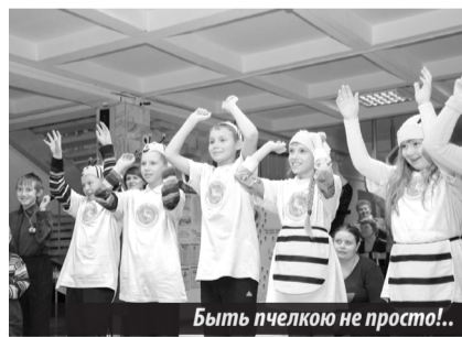
Быть пчелкою не просто!..

ле — полей медоносов». В результате ее реализации в нашей стране появились сады и аллеи из медоносных растений. Благодаря действию акции «Жизнь пчелы — это не мелочь!» удается собирать средства на ряд целевых проектов.