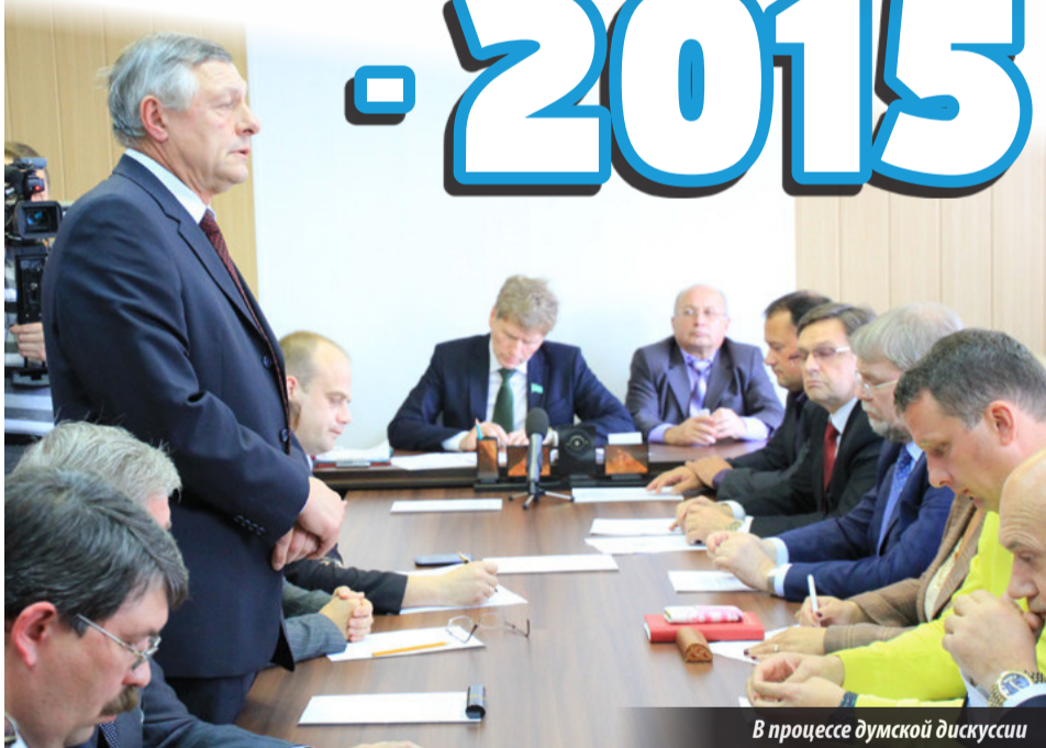
В процессе думской дискуссии