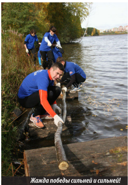
Жажда победы сильнее и сильнее!

Сразу хочется отметить, что многие из этих людей последовали одной известной поговорке: «Готовь сани летом...». А если быть точнее, представители рабочей молодежи города, несмотря на то, что турслет был намечен на субботу, уже с пятницы начали подтягиваться на «Журавлик». Сюда горожане подвезли дров, воды. Каждая команда, нынче их собралось аж 12, разбила на отведенном участке лагерь. Задымили костры, ответственные за полевую кухню принялись варить еду, запахло шашлыком, кашей, похлебкой... Остальным членам команд в это время скучать не приходилось, ведь для участия в турслете нужно было многое приготовить и проверить. Экипировка, принадлежности — все это пригодились ребятам в процессе выполнения различных заданий на этапах, где нужно было не только оказывать первую медицинскую помощь пострадавшему, а затем сплавляться на плоту по волнам, разжигать костры на время, ползать по веревкам, но и уметь ориентироваться на местности, искать азимут. Помимо перечисленного команды представляли су-