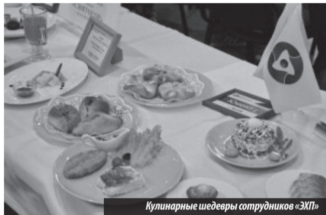
Кулинарные шедевры сотрудников «ЭХП»

Одним из составляющих «ЕврАзии» стал «Российский конкурс по рабочему (корпоративному) питанию—2015», где состязались повара и кондитеры, представляющие корпоративное и рабочее питание. В состязаниях приняли участие 12 команд из городов Свердловской, Челябинской, Тюменской областей и Пермского края. Тема мероприятия: «Русская кухня и другие блюда для здорового