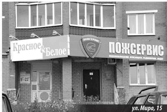
ул. Мира, 15

крупные сети давят местных предпринимателей, так еще и открыто занимаются противоправными деяниями, получая прибыль, минуя предписания, выданные надзорными органами!