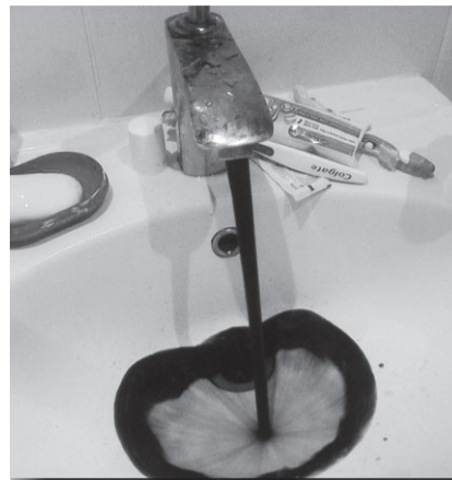
От школы, от работы ты косишь? Почисти зубы, и в больничку махом загремишь!