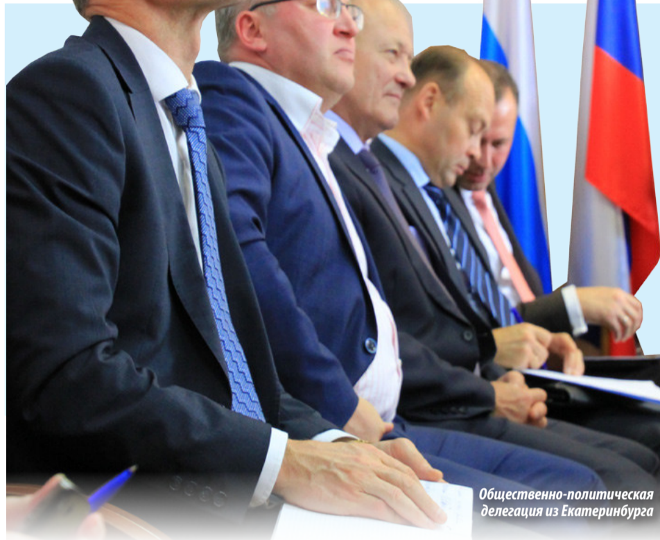
Общественно-политическая делегация из Екатеринбурга

Не меньшее значение имеет формирование безопасной городской среды. Действует программа «Безопасный город», создана хорошая единая диспетчерская служба — «Аварийно-спасательная служба» — с тем, чтобы содействовать комфортному проживанию граждан и формированию их законопослушного поведения.