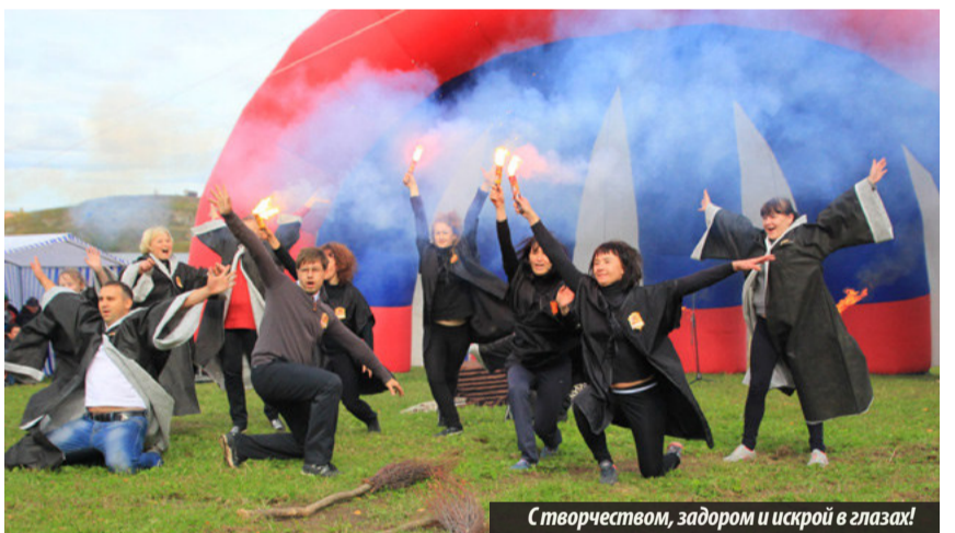
С творчеством, задором и искрой в глазах!

На поляне «Журавлик» прошел общегородской турслет, приуроченный к Году литературы