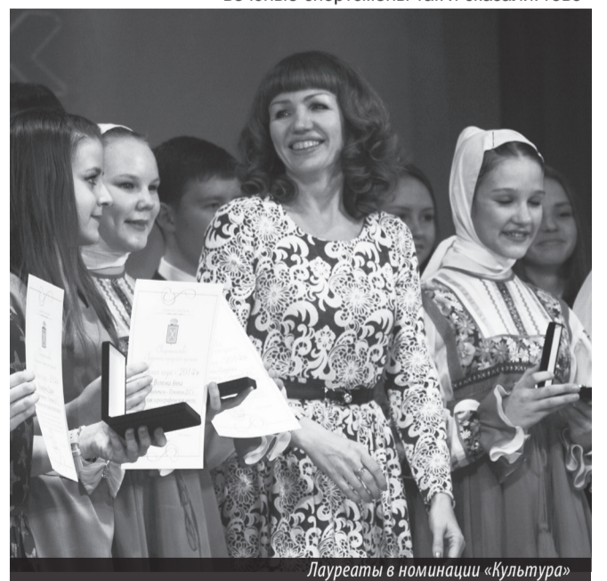
Лауреаты в номинации «Культура»

ческими руководителями, с умеющими поддержать родителями, и они с успехом овладевают этой нелегкой наукой — побеждать. И весь город, его руководители, вся созданная в Лесном прочная система поддержки юных дарований в помощь нашим детям. И отрадно, что совсем еще юные лауреаты главной городской премии прекрасно понимают это, и со сцены звучали искренние слова благодарности учителям, родителям. В ответном слове юные спортсмены так и сказали: гово-