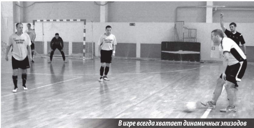
В игре всегда хватает динамичных эпизодов

Открытый чемпионат Горнозаводского округа. III тур. Нижняя Тура. КСК Нижнетуринского ЛПУ МГ «Газпром трансгаз». 17-18.01.2015 г.