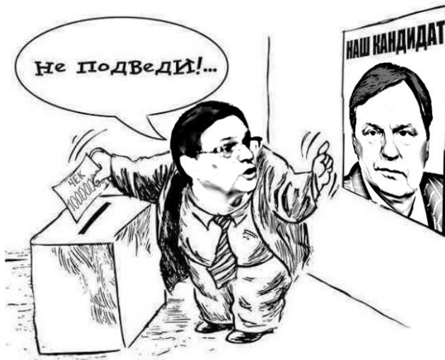
Коллаж А. Бессмертного

Отметая в сторону оскорбления журналистов объединенной редакции газет «Радар» и «Резонанс», поскольку на «дураков» не обижаются, самое время обозреть, как «голь на выдумки хитра».