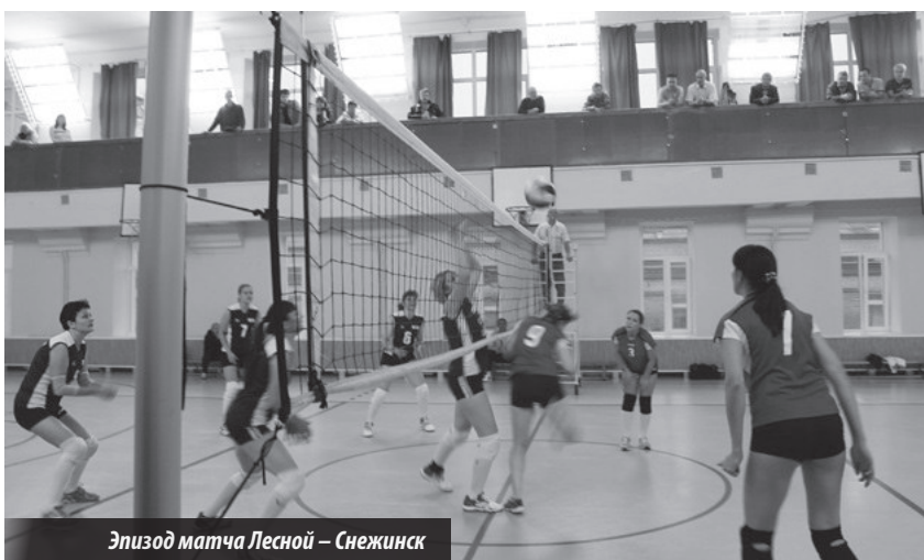
Эпизод матча Лесной – Снежинск

Турнир, посвященный 70-летию образования атомной отрасли. Лесной. Дом физкультуры. 25–26.09.2015