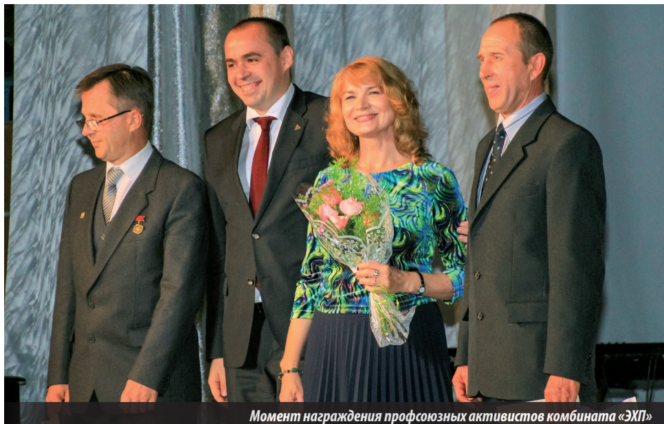
Момент награждения профсоюзных активистов комбината «ЭХП»

сокий профессионализм, опыт и ответственность позволят нам вместе своевременно и с честью выполнять сложные задачи, которые ставит перед нами Родина!