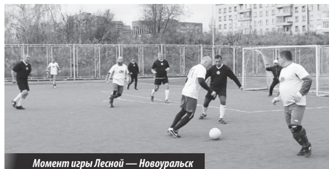
Момент игры Лесной – Новоуральск

Турнир ветеранов, посвященный 70-летию образования атомной отрасли. Лесной. Мини-стадион. 25–27.09.2015