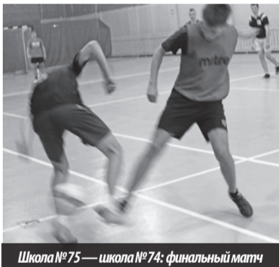
Школа №75 — школа №74: финальный матч

Турнир «Футбольная страна». Юноши 8–9 и 10–11 классов. Лесной. СОК «Факел». 05–09.10.2015.