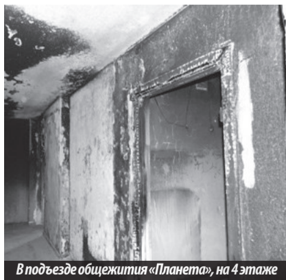
В подъезде общежития «Планета», на 4 этаже