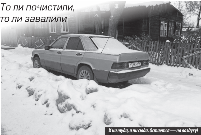
И ни туда, и ни сюда. Остается — по воздуху!

чтобы нож коммунального «помощника» в другую сторону повернуть, оставив, тем самым, свободными проезды к автостоянкам. Зачем? Будто назло засыпают их».