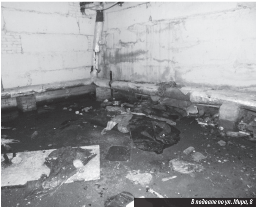
В подвале по ул. Мира, 8

В чиновничьей «галактике» места для них нет