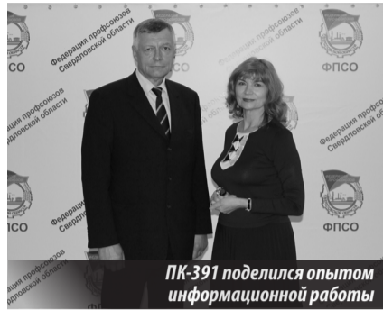
ПК-391 поделился опытом информационной работы

О работе XXV отчетно-выборной конференции Федерации профсоюзов Свердловской области