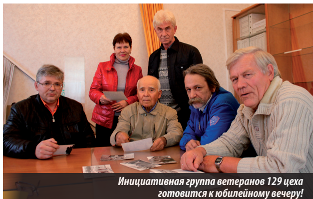
Инициативная группа ветеранов 129 цеха готовится к юбилейному вечеру!