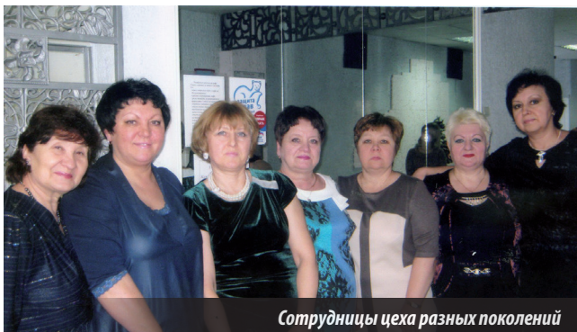
Сотрудницы цеха разных поколений