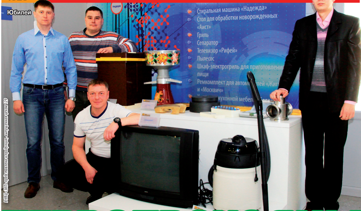
ВЫСТАВКА — ПРЕДСТАВЛЕНА СПРОДУКЦИЕЙ, СОЗДАННОЙ ЦЕХОМ 129