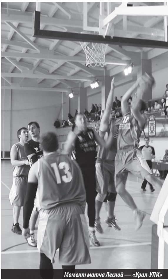
Момент матча Лесной — «Урал-УПИ»