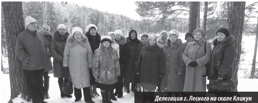
Делегация г. Лесного на скале Кликун

В гостях у поэтического объединения «Кликун»