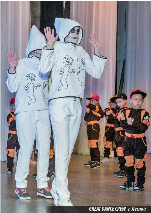
GREAT DANCE CREW, г. Лесной

24 ОКТЯБРЯ в городском Доме культуры Нижней Туры прошел очередной открытый фестиваль молодежных субкультур «Мы вместе!», на который собрались более 100 исполнителей из Лесного, Красноуральска, Екатеринбургa, Нижнего Тагила, Серова, Качканара, Нижней Туры, Волчанска и поселка Восточного.