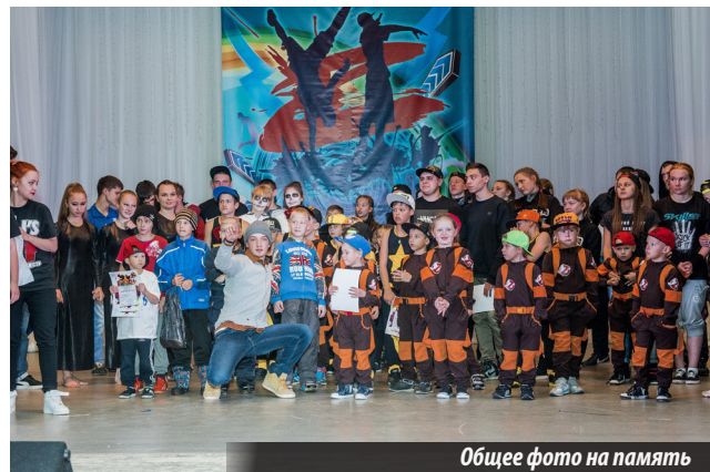
Общее фото на память

Не менее упорной была борьба и среди участников фестиваля, выступавших в номинации «ДЭНС», всего их было 10. В итоге лучше других здесь себя проявили: 1 место — дуэт G.I.Family из г. Лесного; 2 место — MAD TARGET из г. Качканара, 3 место — GREAT DANCE GREW из г. Лесного.