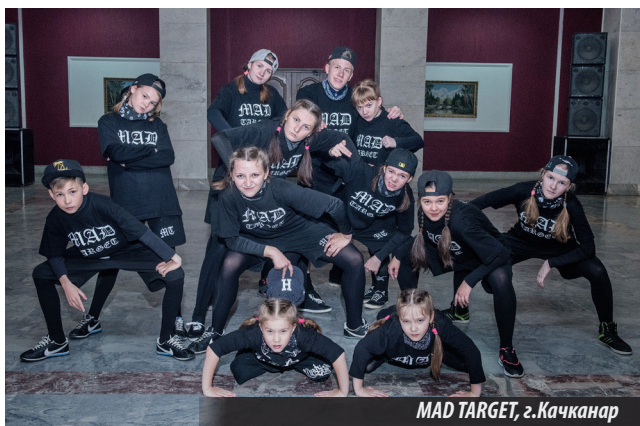
MAD TARGET, г. Качканар

Исполнители сумели так завести зрителей, что те активно поддерживали их, подбегая к сцене, пели, танцевали вместе с ними, энергично жестикулируя. И практически после каждого выступления долго не смолкали овации. Видно, что молодежи такие ритмы по душе.