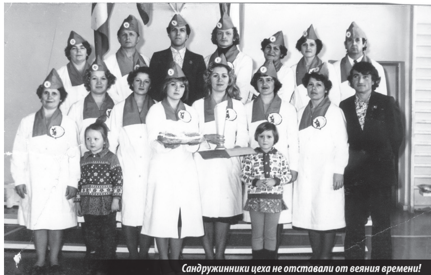
Сандружинники цеха не отставали от веяния времени!

К 60-летию 129 цеха комбината «Электрохимприбор»