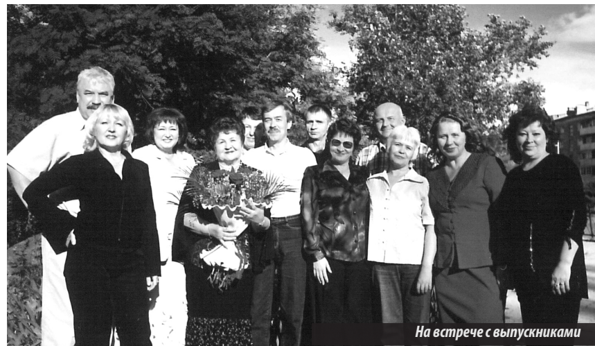
На встрече с выпускниками

эlegantная женщина хоть раз повысила голос или допустила небрежность при подготовке к уроку. Даже записи на доске радовали глаз. Не удивительно, что для своих учеников она всегда оставалась образцом.