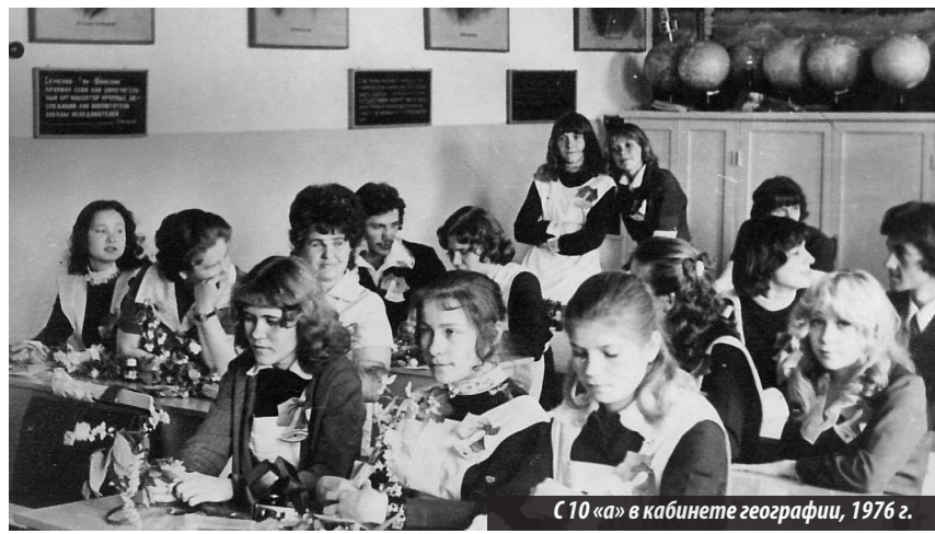
С 10 «а» в кабинете географии, 1976 г.

классной работы и 12 лет — директором школы. «С удовольствием вспоминаю годы работы в школе №2, всегда идущей в ногу со временем, активно работающей над повышением качества образования. С первых же дней я была очарована ат-