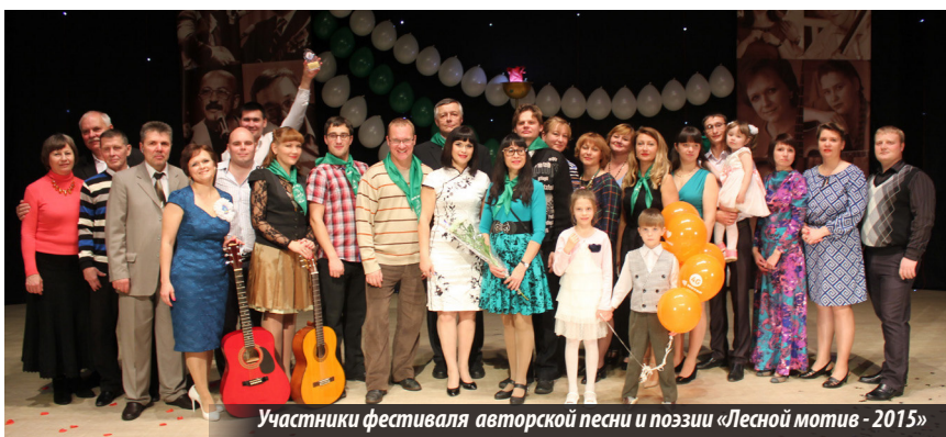
Участники фестиваля авторской песни и поэзии «Лесной мотив - 2015»

Н. МУХИНА, председатель информационной комиссии ПК-391