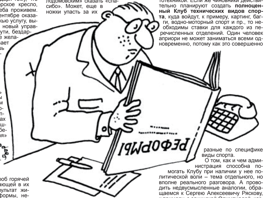
разные по специфике виды спорта.

накупить! И добро пожаловать, мотокросс готов! Сотня ребят уже не будет бездельно мотаться по дворам. Если речь идет исключительно о рождении секции (отделения) мотокросса, тогда предложение в 0,3 ставки принимается. Собственно, мотогощники не из-за денег жадеют популяризовать мотокросс, а ради того, чтобы вытащить ребят с улицы на трассу, увлечь их мототехникой. Если же чиновники действительно планируют создать полноценный Клуб технических видов спорта, куда войдут, к примеру, картинг, багги, водно-моторный спорт и пр., то необходимы ставки для каждого из перечисленных отделений. Один человек априори не может заниматься всеми одновременно, потому как это совершенно