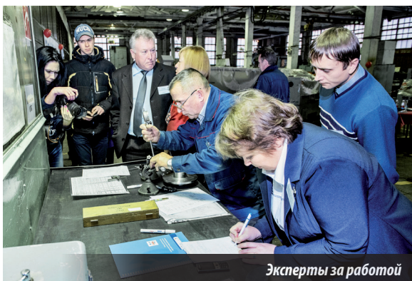
Эксперты за работой