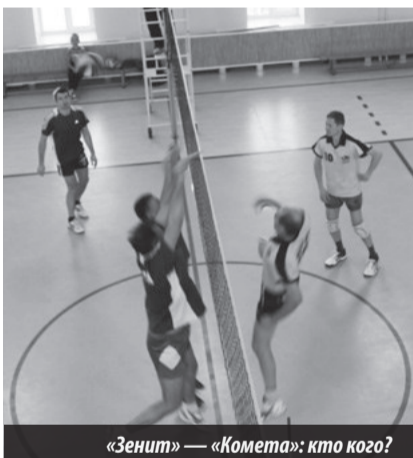
«Зенит» — «Комета»: кто кого?

Кубок генерального директора среди сильнейших команд комбината «ЭХП». Лесной. Дом физкультуры. 21-23.11.2015