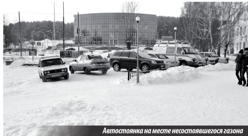
Автостоянка на месте несостоявшегося газона

Н. Тура: когда наведём порядок в городе?..