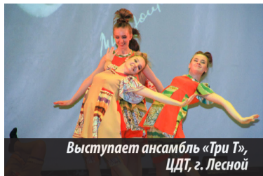
Выступает ансамбль «Три Т», ЦДТ, г. Лесной

Изюминкой вечера стала литературно-музыкальная композиция, показанная чуть позднее в большом зале. Она была поставлена по мотивам произведений русских, советских писателей: М. Зощенко, А. Чехова и др. Отдельные солисты и целые творческие коллективы города и СКДЦ «Современник», принявшие участие в представлении, хорошо постарались, смогли передать со сцены интересные, искромётные мысли и рассуждения героев произведений классиков сатиры в виде романа-шансона, фольклора, рассказа, комедии, заставляя зал сме-