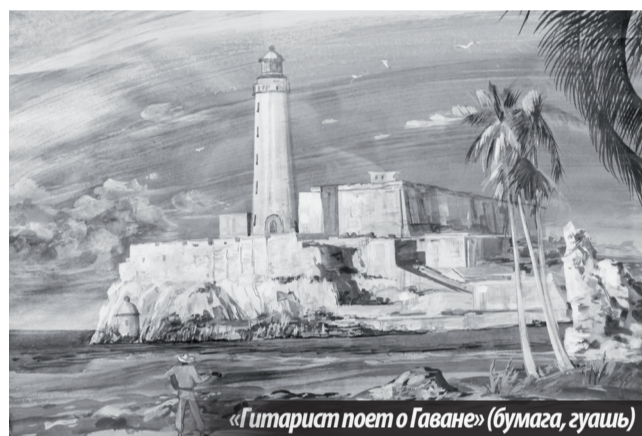
«Гитарист поет о Гаване» (бумага, гуашь)