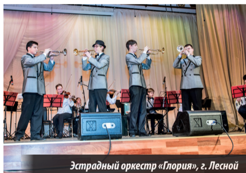
Эстрадный оркестр «Глория», г. Лесной

Ф – «Джазовые ансамбли»; Г – «Эстрадные ансамбли»; Н – «Эстрадные и джазовые вокальные ансамбли»;