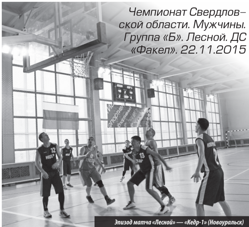
Эпизод матча «Лесной» — «Кедр-1» (Новоуральск)

В тот же день в нашем Дворце спорта встречались «Евраз-Юком» (Екатеринбург) и «Кедр-2» (Новоуральск). Матч