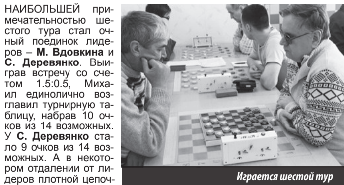
Играется шестой тур

Кубок города. Лесной. Дом физкультуры. 21.11.2015