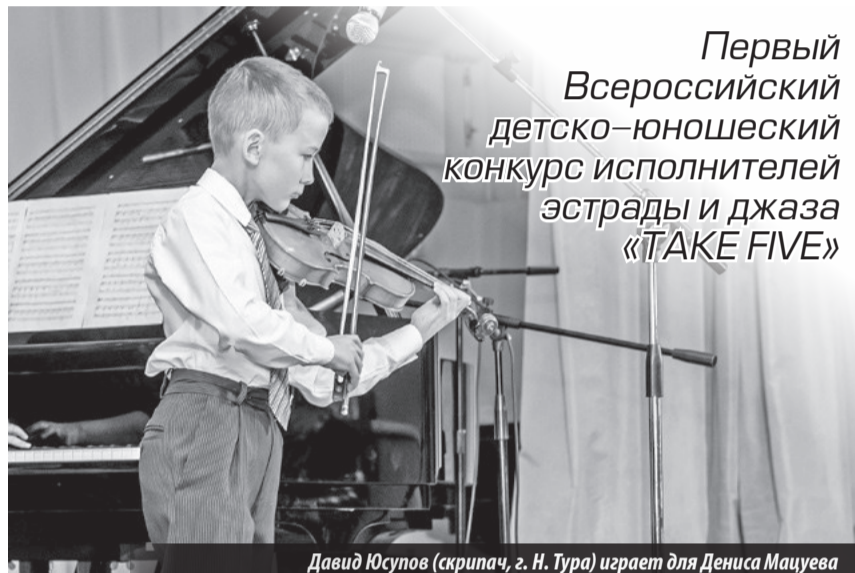
Первый Всероссийский детско-юношеский конкурс исполнителей эстрады и джаза «TAKE FIVE»