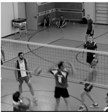
Играют «Комета» - «Знамя»

Кубок генерального директора среди сильнейших команд комбината «ЭХП». Лесной. Дом физкультуры. 25, 28, 29.11.2015