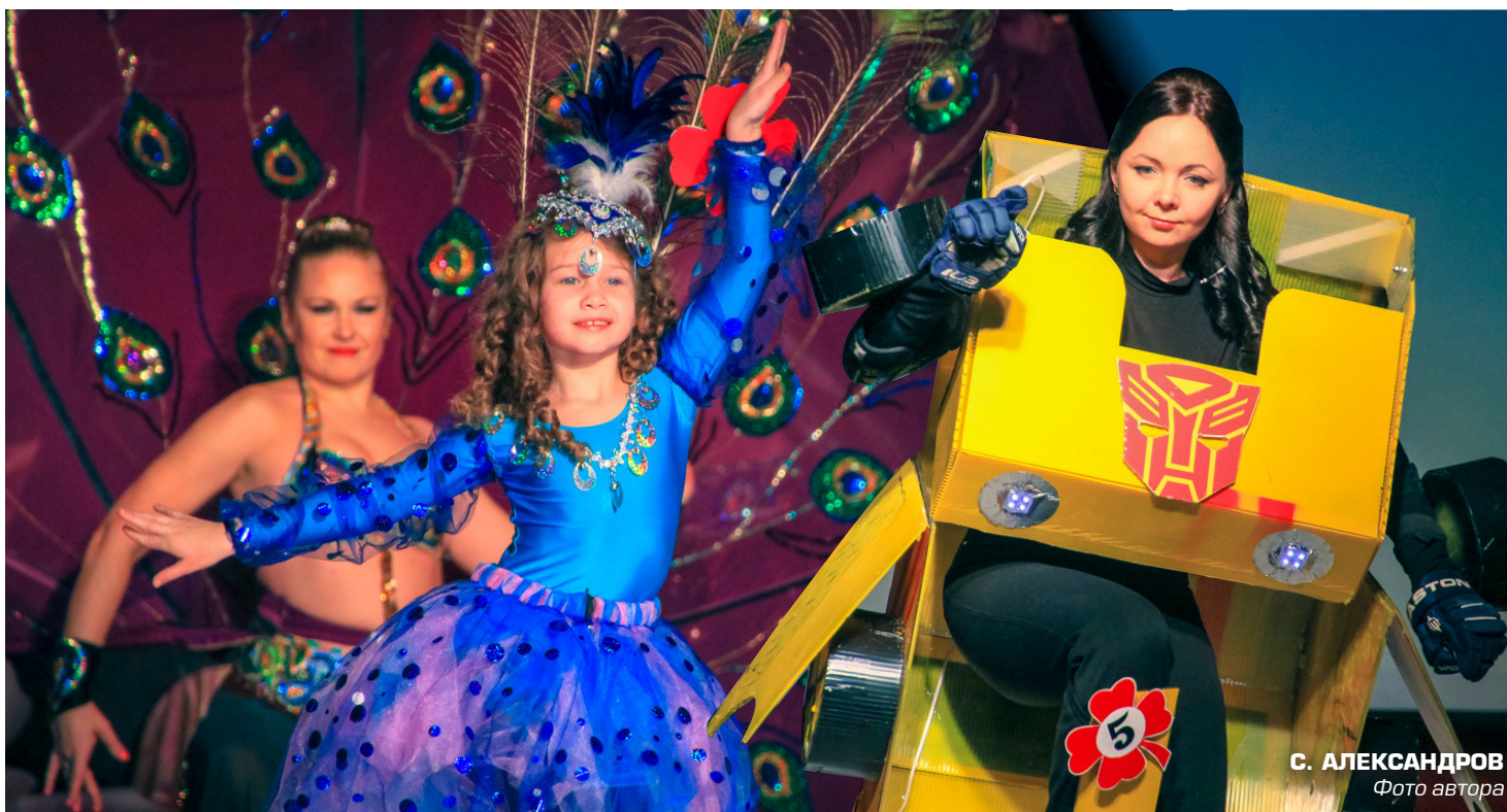
С. АЛЕКСАНДРОВ Фото автора