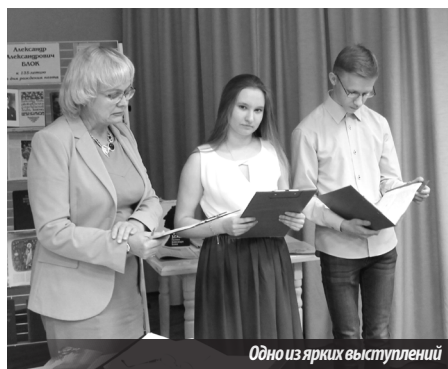
Одно из ярких выступлений

Следующий сборник стихов — « Нечаянная радость » (1907) — свидетельство