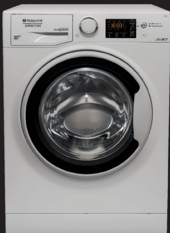
RST 702 X