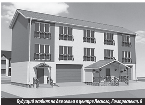
Будущий особняк на две семьи в центре Лесного, Компроект, 8

строике проживало не две семьи, а четырнадцать! Есть разница? Особенно, если учесть тот факт, что в округе полным-полно социальных очередников. Кому нужны особняки, добро пожаловать в мкрн рядом с 51-й вахтой! Стройтесь там! Кто не дает? Для этого и выделяли его под индивидуальную жилищную застройку. Но не надо ставить собственные амбиции выше муниципальных. Это надо же — построить хоромы в центре ЗАТО возле сквера им. Гагарина! Суеще хамство! Давайте в следующий раз отдадим по аукциону площадку СКДЦ «Современник», снедем памятник Ленину и начнем тут огромные хаты в сотни «квадратов» строить для элиты!..»