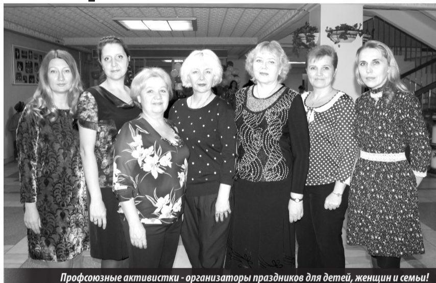
Профсоюзные активистки - организаторы праздников для детей, женщин и семьи!

В МИНУВШУЮ пятницу зал Детской хореографической школы был переполнен гулом от восклицаний «Браво!» и шквала аплодисментов. Здесь собрались представительницы комбината «Электрохимприбор» на праздник в честь Дня матери.