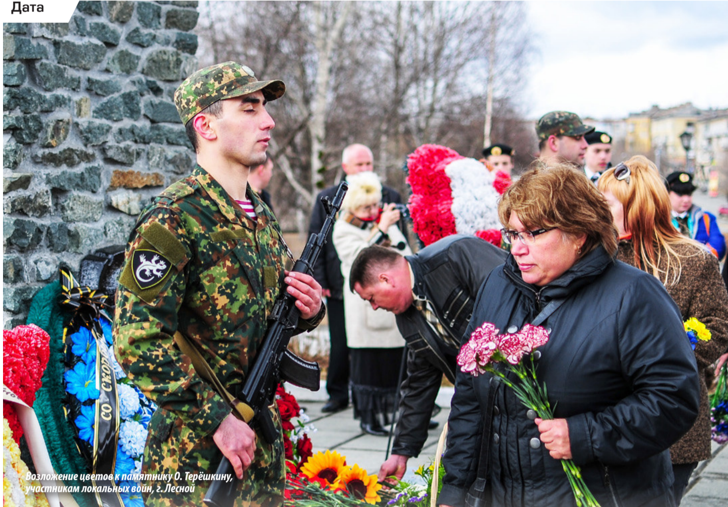
Возложение цветов к памятнику О. Терёшкину, участникам локальных войн, г. Лесной