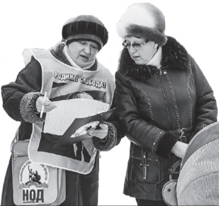
Лесничане активно интересуются информацией

Пикет НОДовцев в нашем городе проходил в районе ТЦ «Метелица» в поддержку проведения общенародного референ-