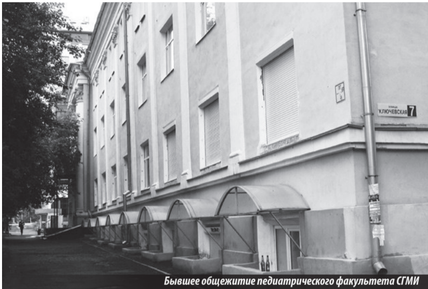
Бывшее общежитие педиатрического факультета СГМИ