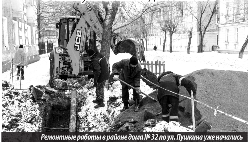
Ремонтные работы в районе дома № 32 по ул. Пушкина уже начались