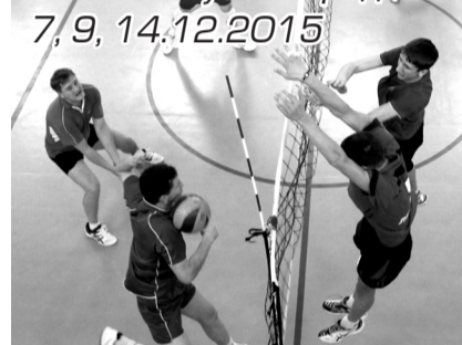
Эпизод матча «Юность» - «Сборная города»

В НЫНЕШНЕМ розыгрыше трофея участвуют 4 коллектива.