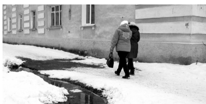
Уже полгода на ул. Пушкина хлещет вода...