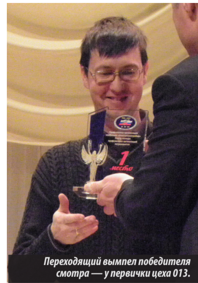
Переходящий вымпел победителя смотра — у первички цеха 013.