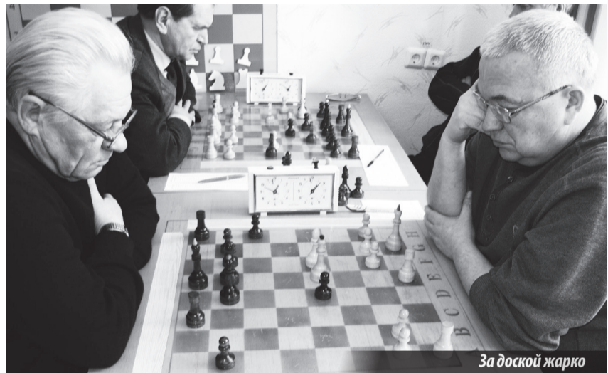
За доской жарко