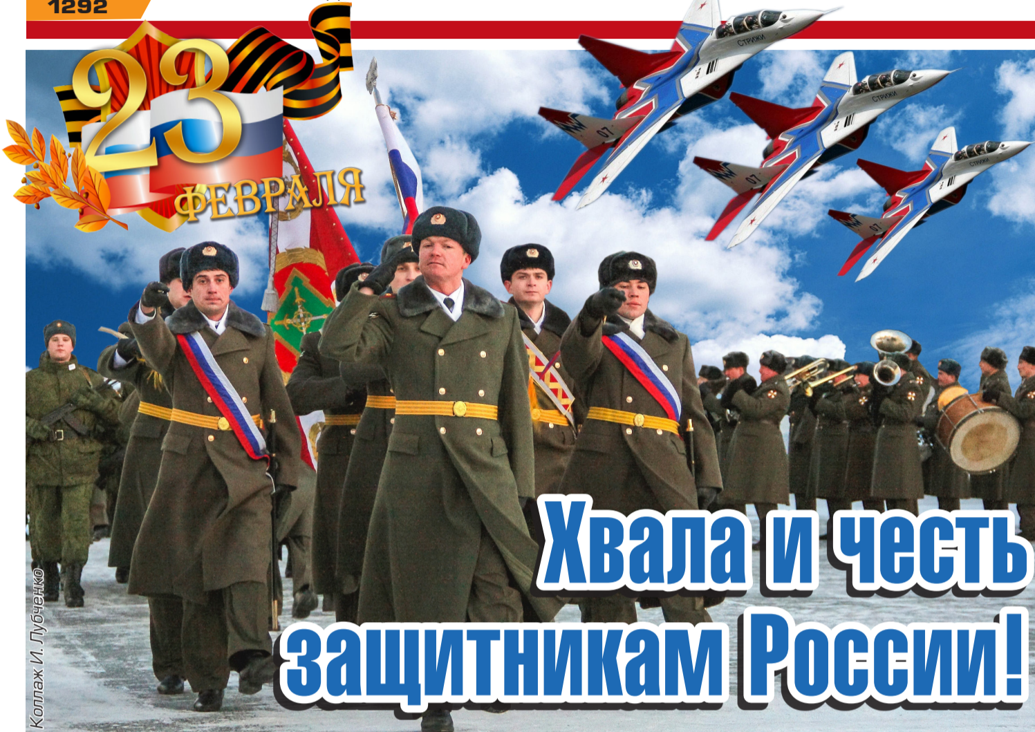
Коллаж И. Лубченко