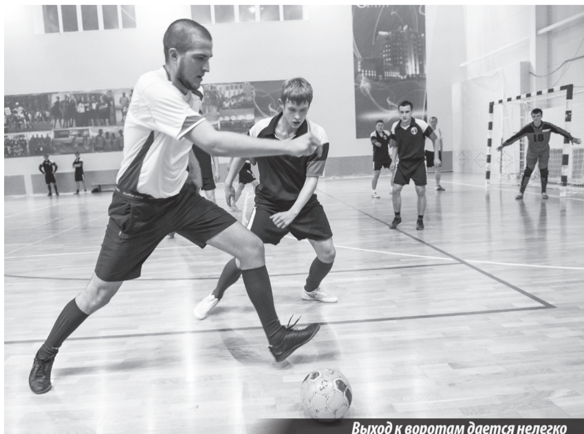
Выход к воротам дается нелегко

В НИЖНЕЙ ТУРЕ продолжаются соревнования в зачет городской спартакиады среди производственных предприятий.