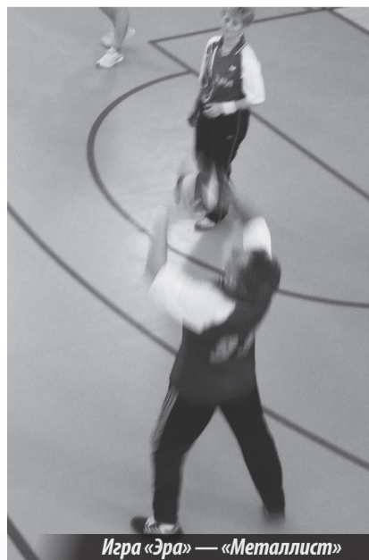
Игра «Эра» — «Металлист»