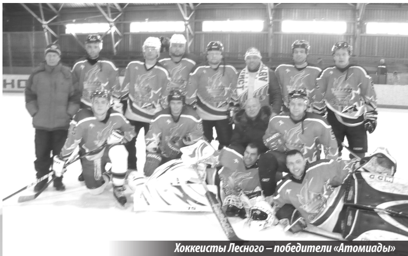
Хоккеисты Лесного — победители «Атомиады»