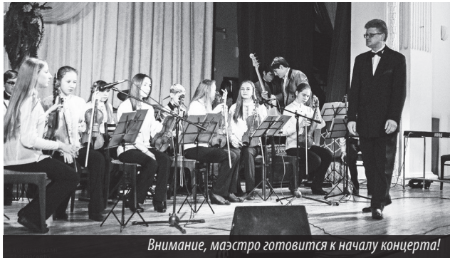
Внимание, маэстро готовится к началу концерта!

НА ДНЯХ я с удовольствием побывала на концерте эстрадного оркестра «Глория» МБОУДОД «Центр детского творчества».