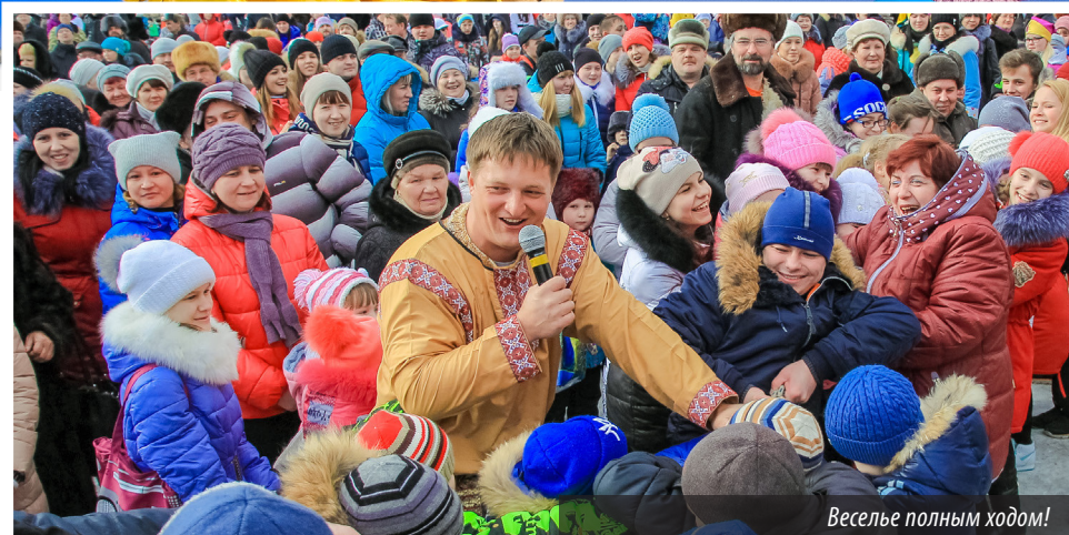
Веселье полным ходом!