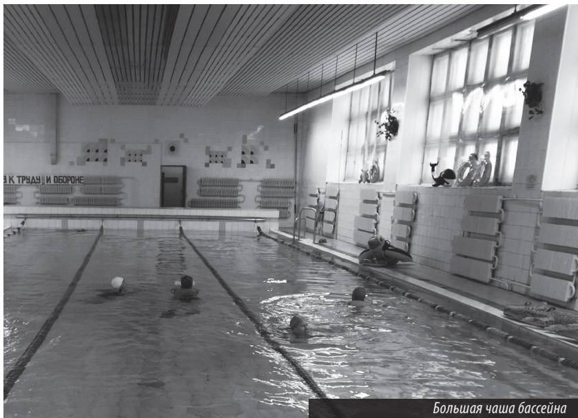
Большая чаша бассейна

О спортивно-оздоровительном комплексе школы №76