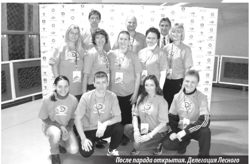
После парада открытия. Делегация Лесного

ПРИГЛАШАЕМ всех желающих принять участие в «Веселых стартах», которые пройдут на берегу озера Капитановка. Обязательно захватите с собой бутерброды и хорошее настроение. А организаторы обещают горячий чай и уху. 28 февраля в 11:00 — начало соревнований