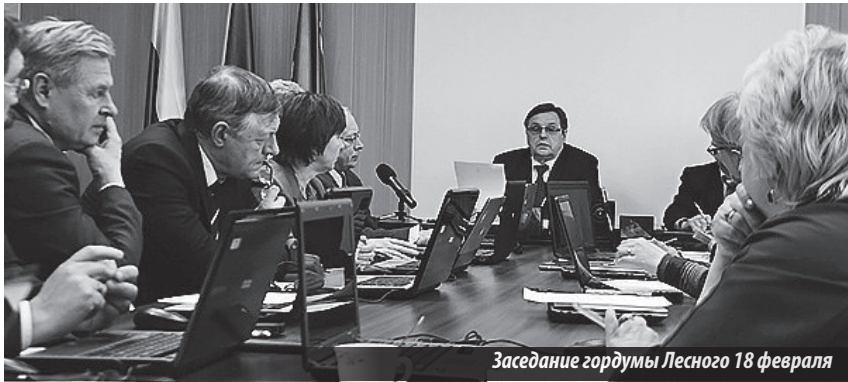
Заседание гордумы Лесного 18 февраля

ствии какого-либо конфликта с градообразующим предприятием, — сложные отношения города и комбината. Та же администрация признает отсутствие общего понимания с «Электрхимприбором» в вопросе приема сетевого хозяйства, ежегодно вкладывающего и без срыва сроков в реконструкцию коммунальных сетей порядка 50-ти млн рублей .