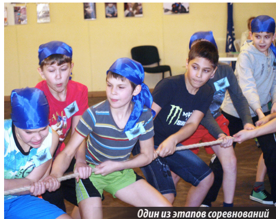
Один из этапов соревнований

Итоги игры таковы: 1 место заняла команда «Комбат-76» из школы №76, 2-е место у «Русских витязей» из лицея, 3-е — у команды школы № 64 — «Омон». Впрочем, удовольствие от настоящей нешуточной борьбы получили все, подарки и дипломы — конечно, тоже!