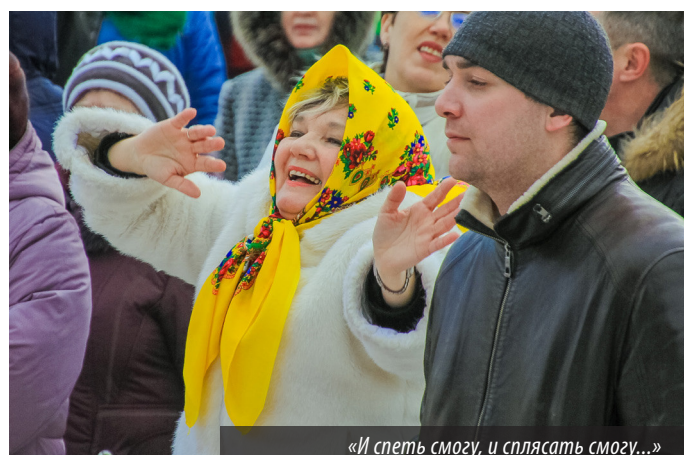
«И спеть смогу, и сплясать смогу...»