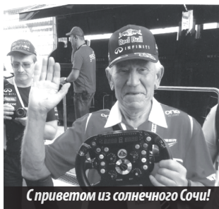
С приветом из солнечного Сочи!