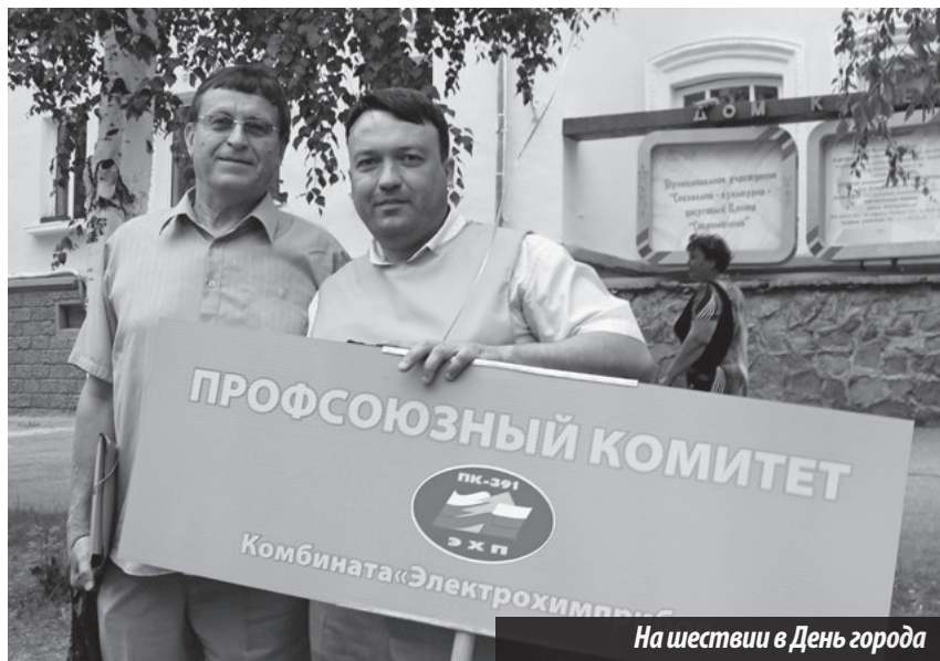
На шествии в День города

Так случилось, что знаю его очень давно. В мае 1990 года я оставила свою любимую радиожурналистику и перешла работать в отдел кадров комбината «ЭХП». Трудовой путь начала заново, так сказать, с чистого листа, с должности рядового инспектора, отвечающе-