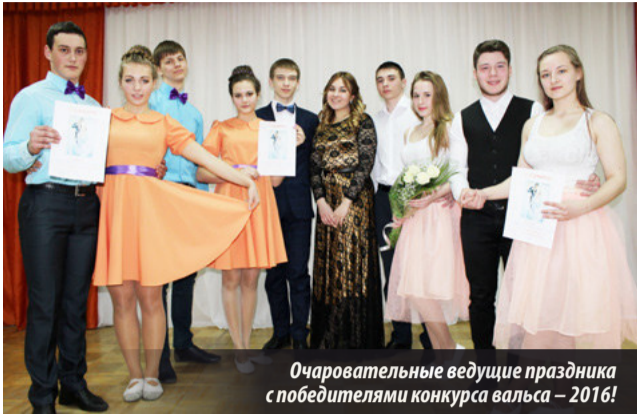
Очаровательные ведущие праздника — победителями конкурса вальса — 2016!

ВСЕМИ любимый танец вальс ещё юн, он живёт лишь третьим веком, и никто не может назвать имя человека, придумавшего его или точную дату рождения танца. Своим рождением вальс обязан многим танцам разных народов Европы, но родиной вальса по праву считают Германию и Австрию.