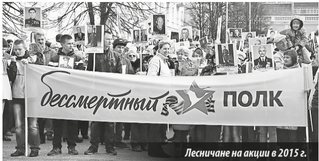
Лесничане на акции в 2015 г.

В ЭТОМ ГОДУ акция, ставшая уже традиционной, пройдет в четвертый раз.