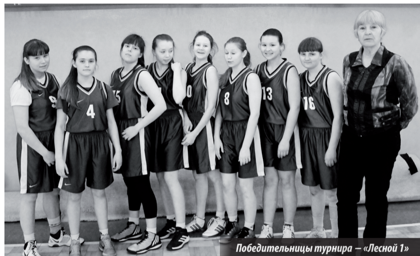
Победительницы турнира – «Лесной-1»

Открытое первенство города среди девушек и юношей «Весна в Лесном». Лесной. ДЮСШ (ул. Мира, 30). 18-20.03.2016