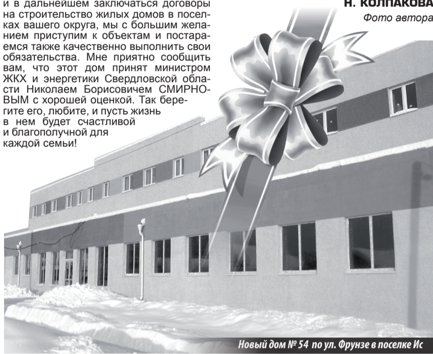
Новый дом № 54 по ул. Фрунзе в поселке Ис