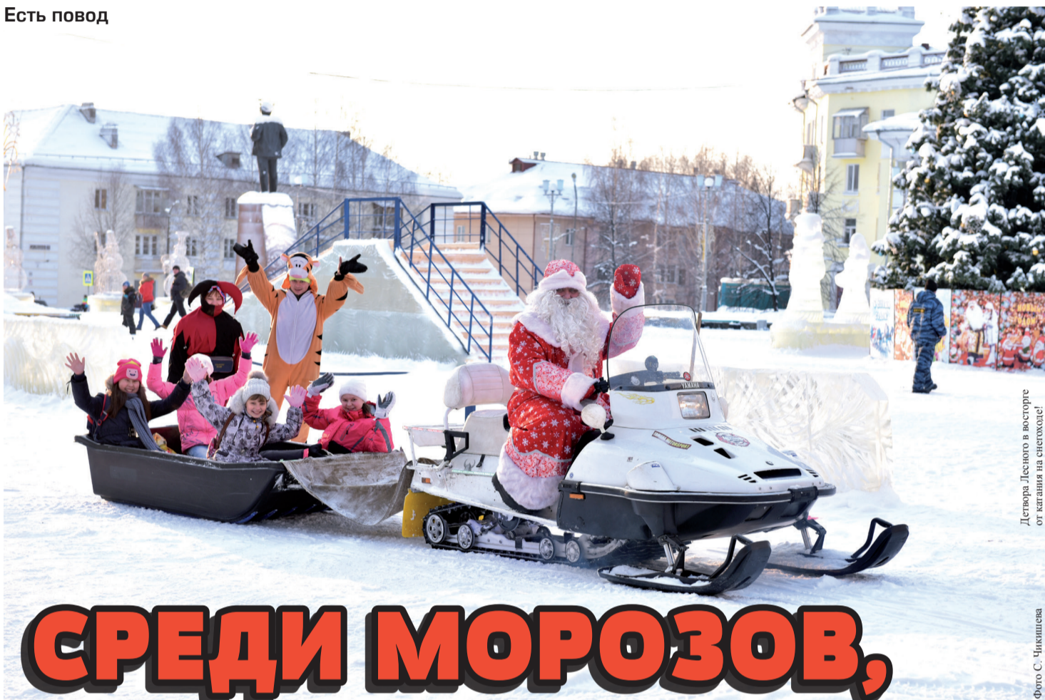
Детвора Лесного в восторге от катания на снегоходе!