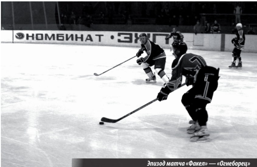
Эпизод матча «Факел» — «Огнеборец»