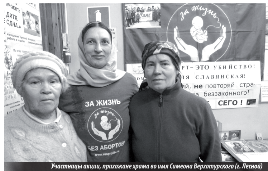
Участницы акции, прихожане храма во имя Симеона Верхотурского (г. Лесной)

К Дню памяти Вифлеемских младенцев-мучеников