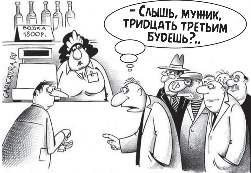
О проблеме, набирающей серьезные обороты

Действительно, альтернатива агропромовскому продовольственному объекту в виде «Семи пятниц» подобралась незавидная. Сколько аналогичных точек под брендом «Красное&Белое» в Лесном образовалось, уже со счету сбилось. Торгуют спиртным они возле общеобразовательных, художественной, детской хореографической школ, в нарушение требований продают сигареты, за что недавно оштрафованы Роспотребнадзором на кругленькую сумму. Но что могут дать денежные штрафы? Проблемы алкоголизации общества они не решат. Необходимо политическая воля руководства ЗАТО, чтобы остановить лихорадочное развитие алкобизнеса, чтобы он как спрут не расплодился по всей территории округа и не залез в каждый дом. Засилье алкомаркетов на рынке города Лесного бросается в глаза. И, судя по комментариям жителей, даже режет их. Бессовестные сетевые активно наступают на город. Однако муниципальные власти не особо им препятствуют в этом. Точнее, совсем не препятствуют. С таким подходом в скором времени алкополиции да алкомаркеты станут поводом для гордости нашим округом. Чиновники лишь имитируют озабоченность здоровьем лесничан, выступая