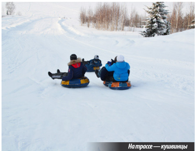
На трассе — кушвинцы

ЧЕМ заняться, где приложить свой талант, свою энергию? Такой вопрос неизбежно встает перед российской молодежью, в том числе живущей в Верхней Туре.