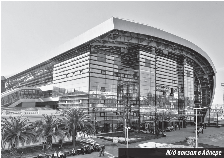
Ж/д вокзал в Адлере

ОАО «Тизол» — поставщик материалов на Олимпиаду-2014