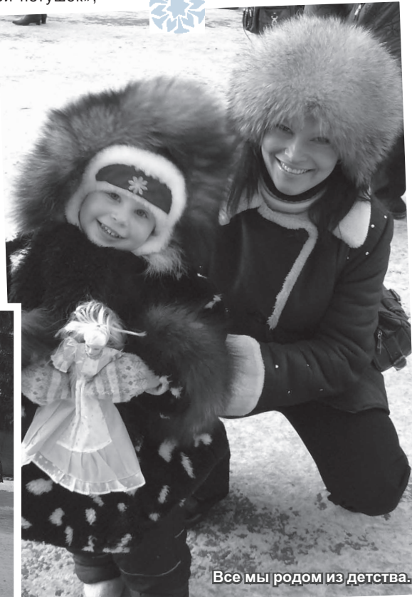
Все мы родом из детства.