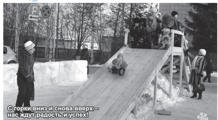
С горки вниз и снова вверх – нас ждут радость и успех!