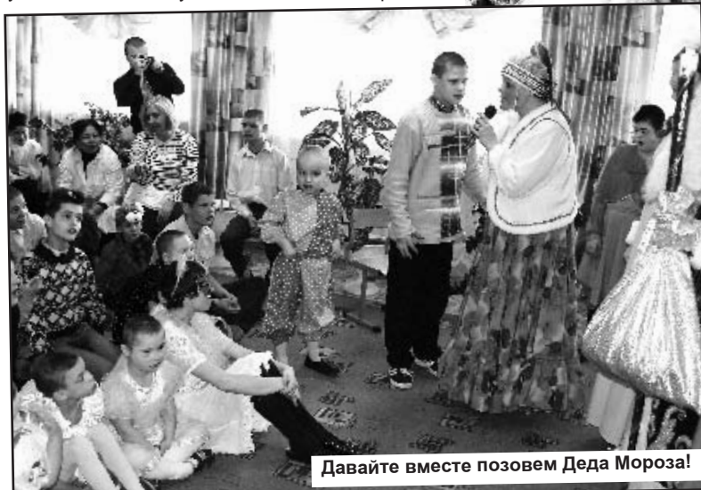
Давайте вместе позовем Деда Мороза!