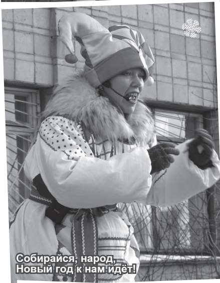
Собирайся, народ, Новый год к нам идет!