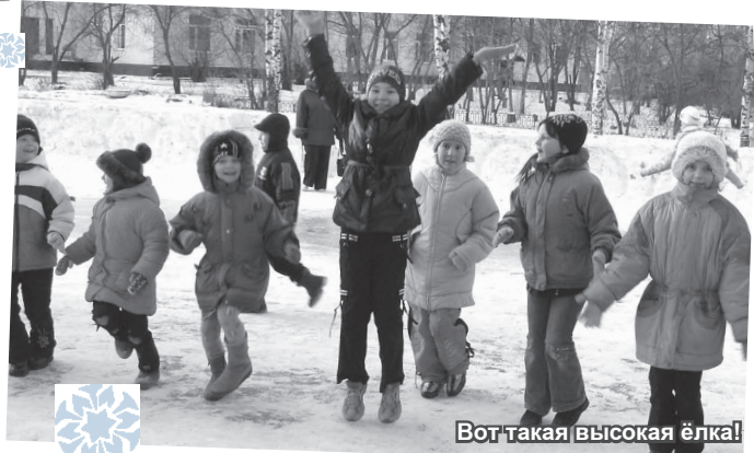
Вот такая высокая ёлка!