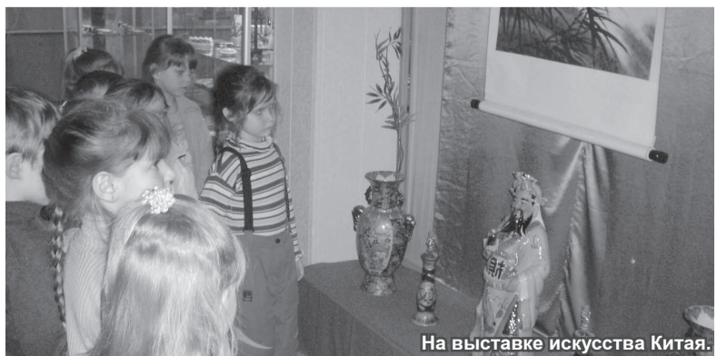
На выставке искусства Китая.

Воспитатели и дети старших и подготовительных групп детского сада «Золотой петушок», г. Лесной.