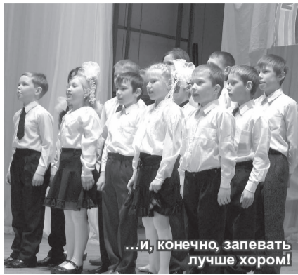
...и, конечно, запевать лучше хором!

Сетовать на то, что в нашем городе мало талантливых людей, по меньшей мере, опрометчиво и несправедливо.