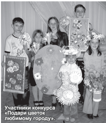
Участники конкурса «Подари цветок любимому городу».