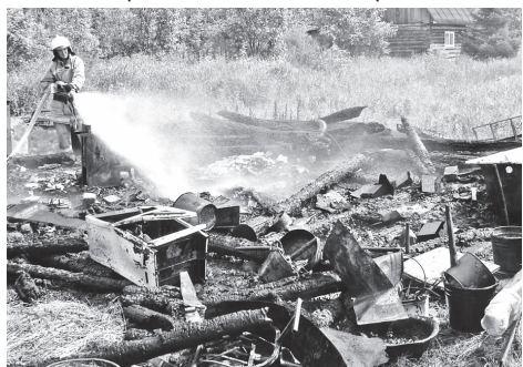
ЦПП и ОС СУ ФПС №6 МЧС России.

30 июня во втором часу дня в коллективном саду №35 (п. Горный) на территории своего садового участка женщина топила печь, предварительно сняв металлическое колесо с печной трубы. Из-за нарушения устройства отопительной печи и дымохода дом загорелся. Площадь пожара составила 6 кв. метров.