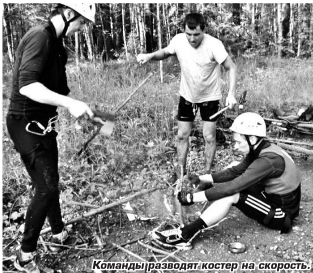
Команды разводят костер на скорость.

10-11 июля на берегу озера Капитоновское расположился палаточный городок, где собралось восемнадцать команд из разных городов и поселков: Лесного, Н. Туры, Краснотуринска, Югорска, Перегрёбинского, Иса, Светлого, Пельыма, Сорума, Ондры. Сюда приехали, чтобы проверить себя на прочность, занять