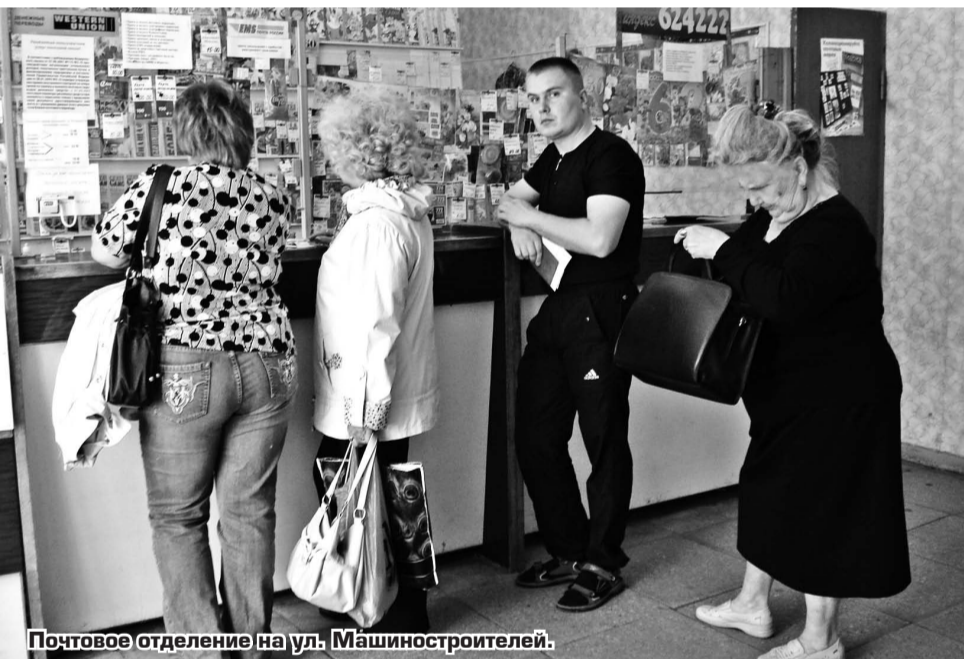
Почтовое отделение на ул. Машиностроителей.

Наверняка за последние годы падает количество отправляемых писем?