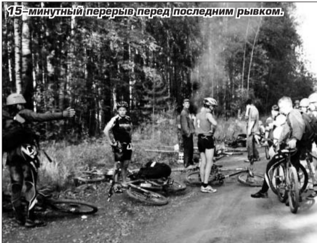
15-минутный перерыв перед последним рывком.

призовое место и, конечно же, встретиться со старыми знакомыми и друзьями.