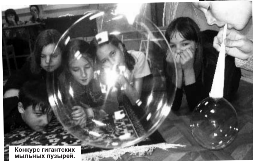
Конкурс гигантских мыльных пузырей.

но что удивительно, все остались в лагере, и никто об этом не пожалел. От многих слышала, что это был самый чудесный и сказочный Новый год. Потому что начался он с большого концерта, где каждый отряд представил, как справляют Новый год в раз-