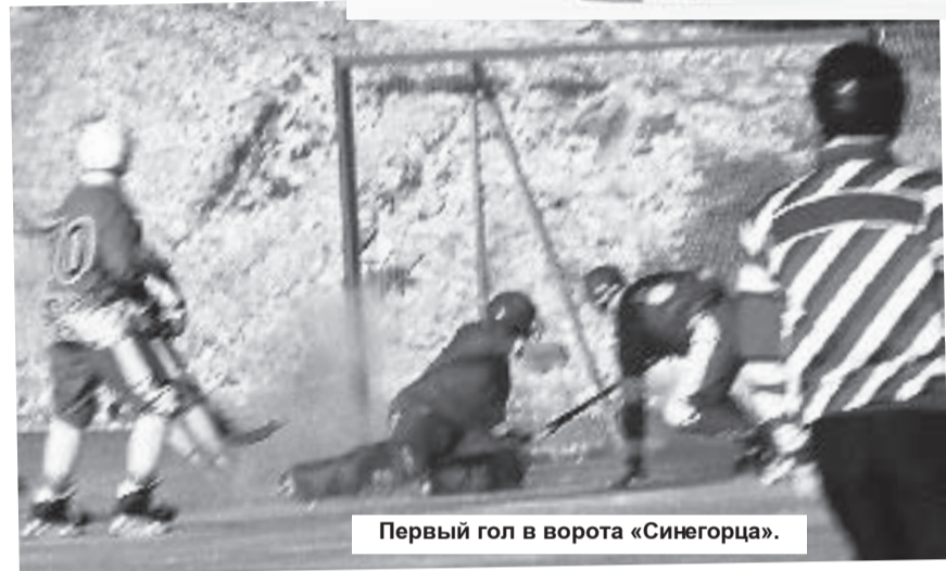
Первый гол в ворота «Синегорца».