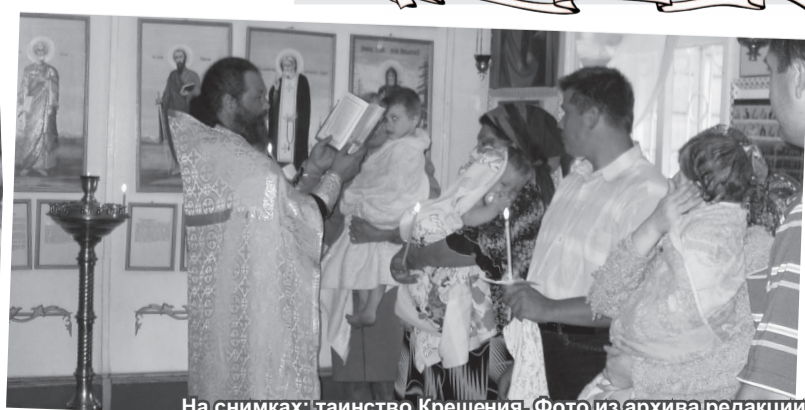
На снимках: таинство Крещения.