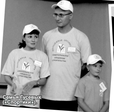
Семья Гусевых («Спортики»).