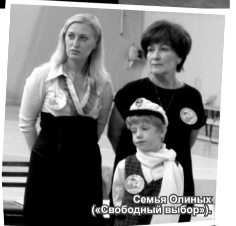
Семья Олиных («Свободный выбор»).