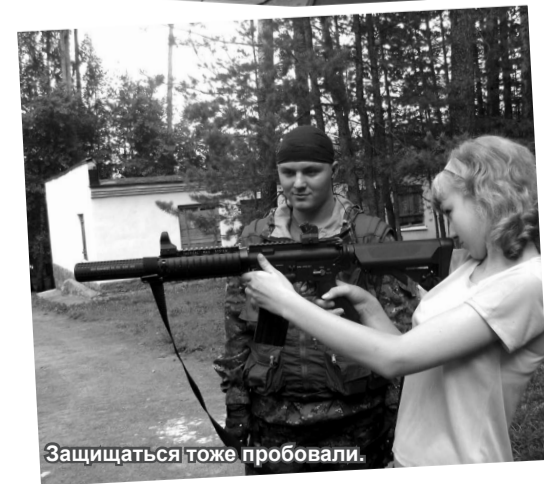
Защищаться тоже пробовали.