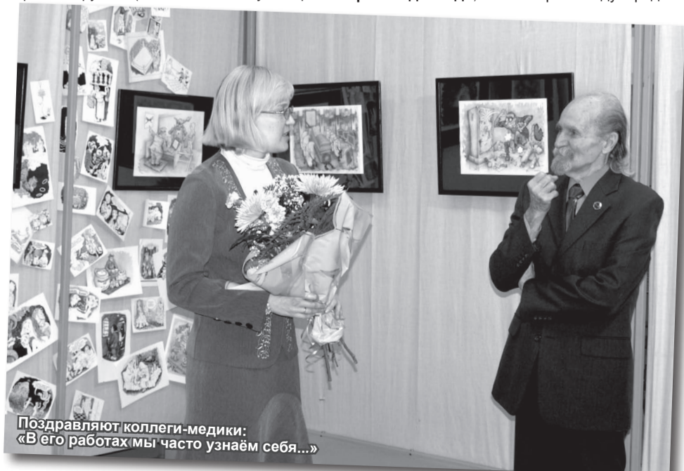
Поздравляют коллеги-медики: «В его работах мы часто узнаём себя...»