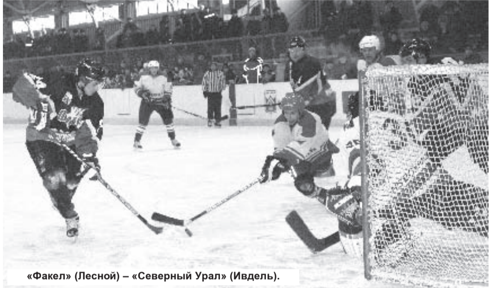
«Факел» (Лесной) – «Северный Урал» (Ивдель).

Теперь 7 февраля «Газовик» играет в Кушве, а 14 и 15 февраля в 14 часов дома принимает «Святогор» (Красноуральск) и «Союз-НТ» (Н.Тагил).