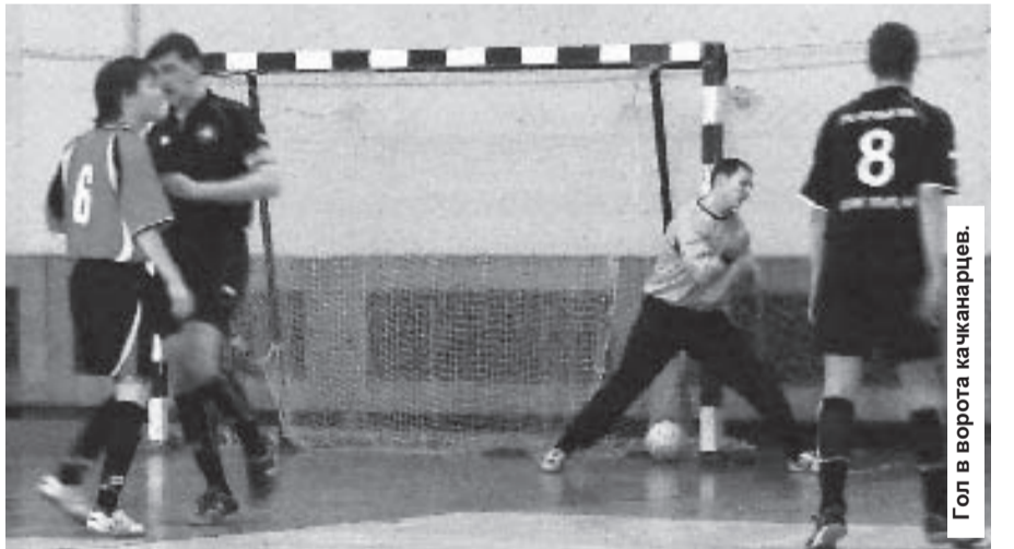
Гол в ворота качканарцев.