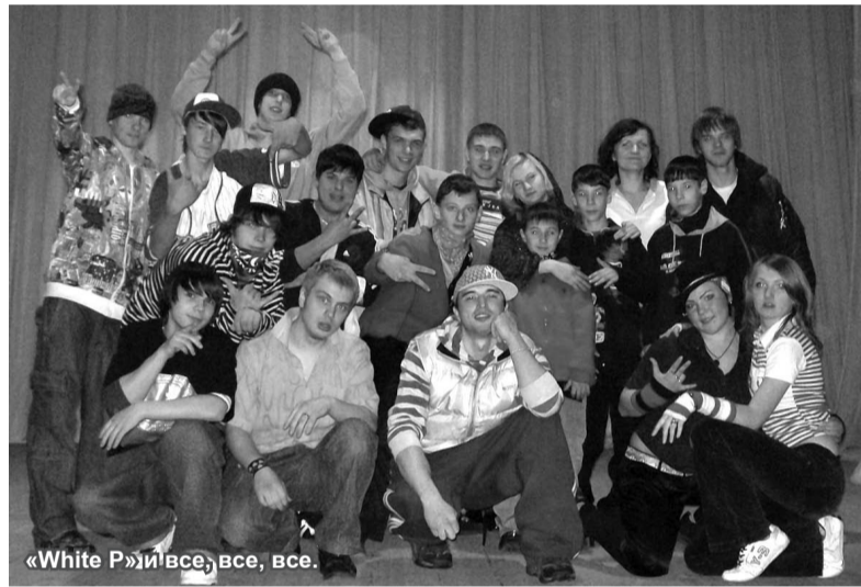
«White P» и все, все, все.