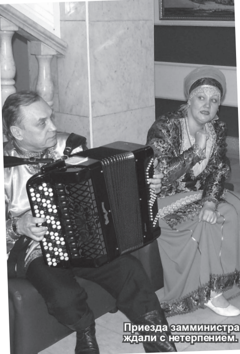
Приезда замминистра ждали с нетерпением.