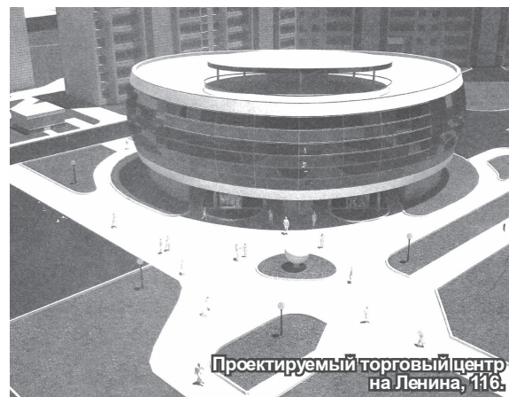
Проектируемый торговый центр на Ленина, 116.

Подробно остановились на таких объектах, как супермаркет «Мегамаст»: он займет место на продолжении ул. Победы и ул. Юбилейной, и так называемое здание общественного назначения, которое разместится около жилых домов по Ленина, 102. На первом этаже будет бильярдный зал, на втором – массажное отделение, сауна и парикмахерская.