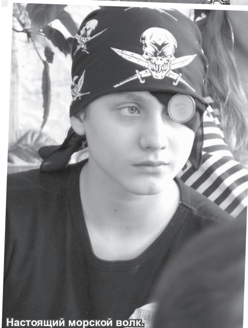
Настоящий морской волк.

Все ли вы, многоуважаемые родители, знаете, чем занимаются ваши дети в школе? Держу пари, что не все! А ваши дети между тем самые настоящие пираты и завоеватели. Только завоевывают они не золото, а знания.