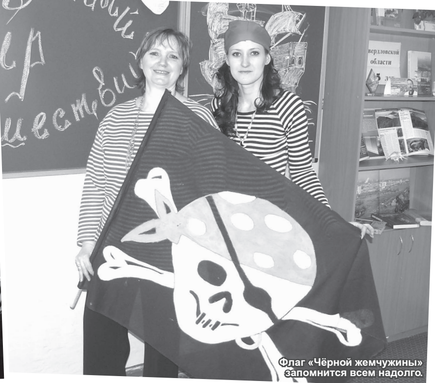
Флаг «Чёрной жемчужины» запомнится всем надолго.