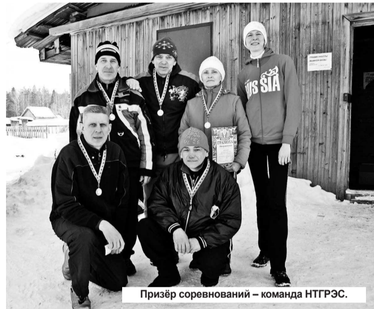
Призёр соревнований – команда НТГРЭС.