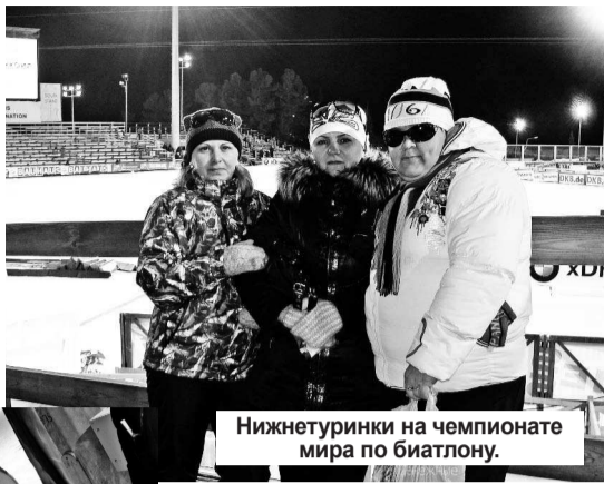
Нижнетурички на чемпионате мира по биатлону.

Но у нас это получилось. Благо чемпионат проходил в Ханты-Мансийске, этот город от нас не так уж и далеко. Эмоции от увиденного переполняют. Такой красоты, такого дру-