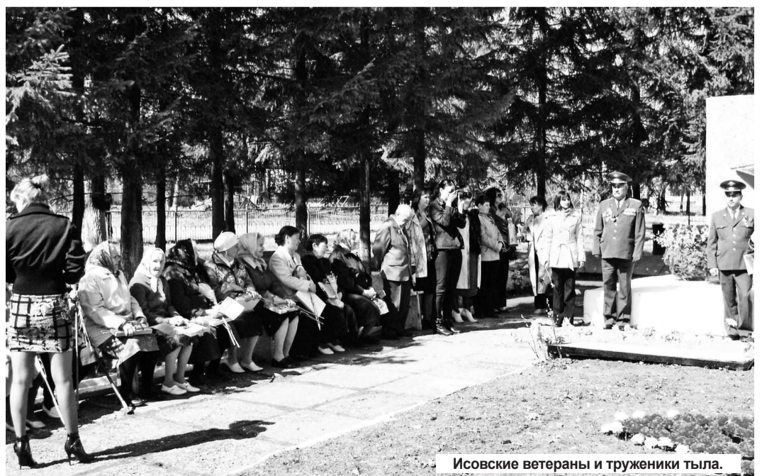
Исовские ветераны и труженики тыла.