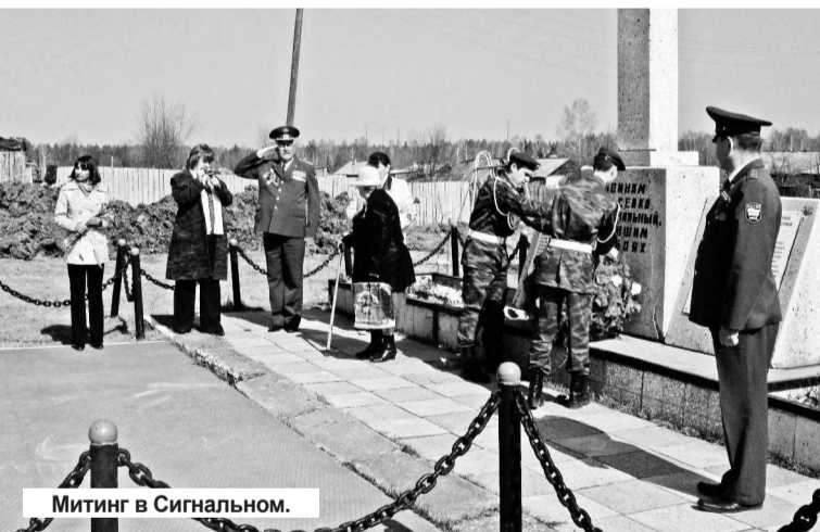
Митинг в Сигнальном.

6 мая, уже в четвертый раз, состоялся автопробег по поселкам, расположенным на территории Нижнетуринского городского округа: Ис, Сигнальный, Косья. Он был посвящен Победе в Великой Отечественной войне. В пробеге участвовали около десяти автомобилей, украшенных флагами России и местных организаций.