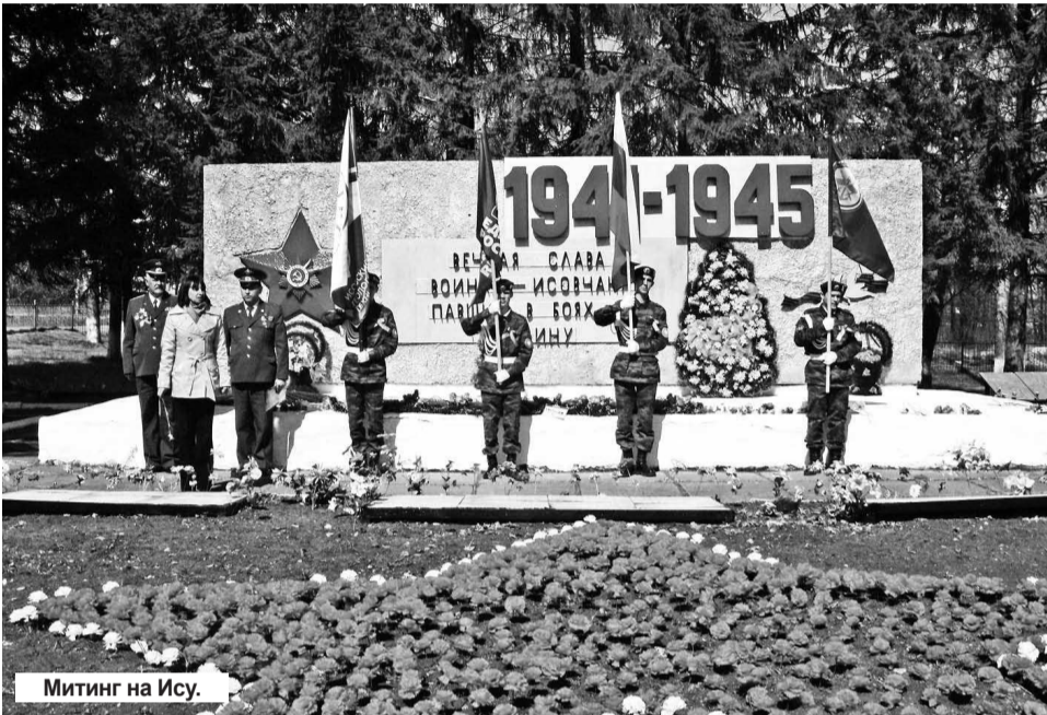
Митинг на Ису.