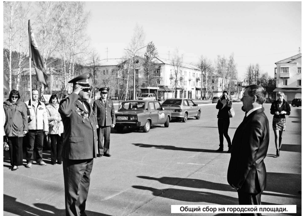
Общий сбор на городской площади.