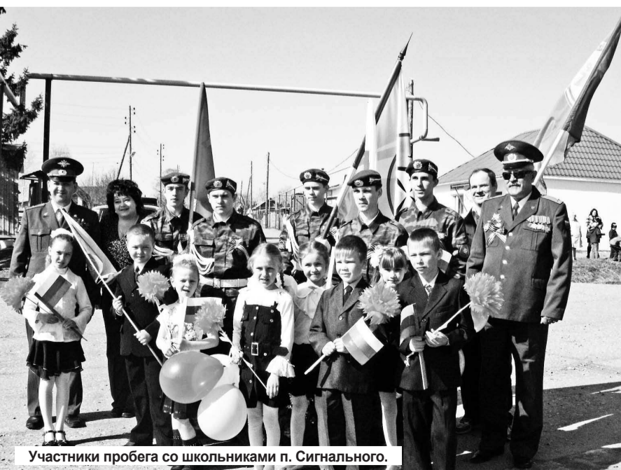
Участники пробега со школьниками п. Сигнального.