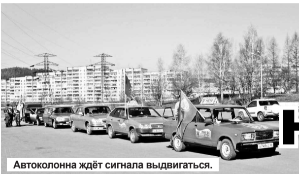
Автоколонна ждёт сигнала выдвигаться.