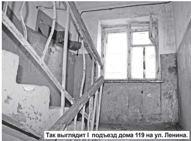
Так выглядит 1 подъезд дома 119 на ул. Ленина.

«Добрый день! Пишут вам жильцы первого подъезда дома № 119 на улице Ленина (г. Нижняя Тура). Мы не раз обращались к руководителям сферы ЖКХ города с жалобой на безобразное состояние нашего подъезда, но там нам ответили, что его капитальный ремонт возможен только согласно очереди, и предлагают ее дожидаться. Но сколько можно ждать? Наш подъезд превратился в приют для бомжей. Двери его постоянно (даже зимой) открыты настежь. В подъезде – грязно, в тамбуре – тень, бомжи и прохожие устроили здесь туалет, почтовые ящики сломаны, квитанции на оплату коммунальных услуг раскладывают на подоконниках (счета валяются по всему подъезду). Чтобы заплатить вовремя за квартиру, мы едем за копиями квитанций на ГРЭС. И это – постоянная проблема. Ну когда же будет порядок в нашем подъезде? Это письмо вы можете расценить как крик души.»