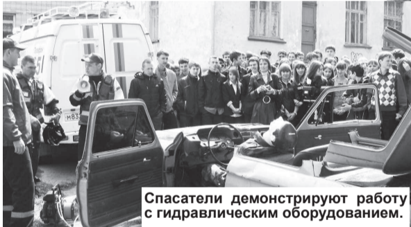
Спасатели демонстрируют работу с гидравлическим оборудованием.