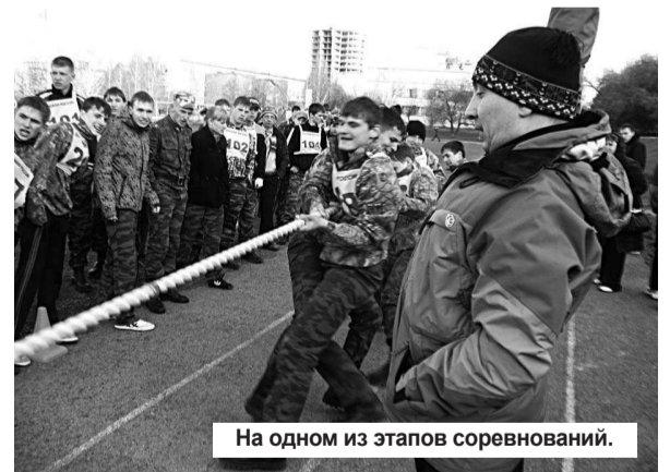
На одном из этапов соревнований.