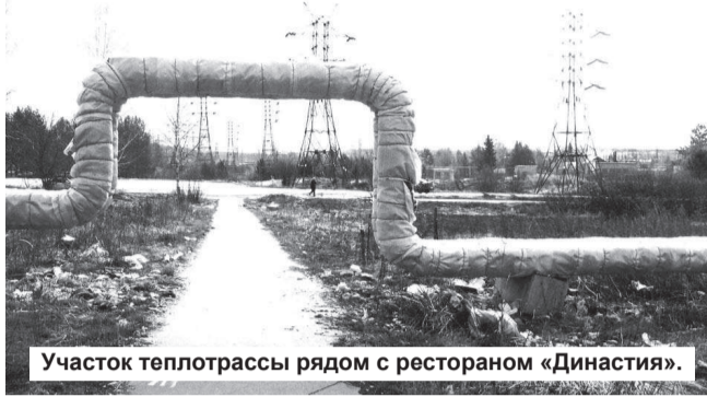
Участок теплотрассы рядом с рестораном «Династия».

В НОМЕРЕ 42 нашей газеты от 14 октября 2010 года была напечатана статья под заглавием «Голая теплотрасса», где была отражена картина вопиющей бесхозяйственности, которую допустили коммунальщики, обслуживая систему теплоснабжения города. С тех пор состояние «воздушки» – теплотрассы с диаметром трубы 300 мм, проложенной от станции к пункту распределения подачи тепла к каскадным домам по улице Машиностроителей, значительно улучшилось. Теперь она одета. Эксплуатирующая теплотрассу организация приняла меры. Теперь от этого отрезка трубы улица уже не отапливается – теплотрасса функционирует по прямому назначению, передавая тепло жителям Нижней Туры.