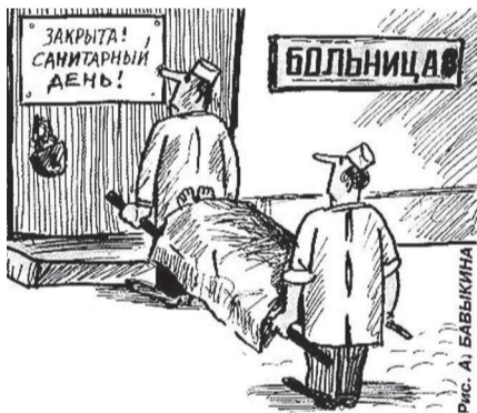
Рис. А.И. БАБАЙКИНА