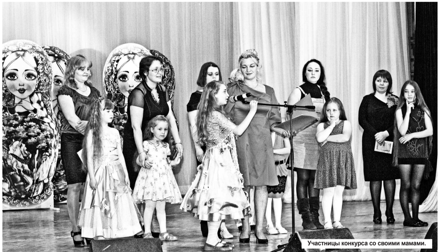
Участницы конкурса со своими мамами.

А пока участницы готовились к конкурсам, зрителей развлекали артисты: хореографический коллектив «Оле Лукойе», вокальный ансамбль «Ассорти», ансамбль современного танца «Антре» и другие. Программа мероприятия была очень насыщенной. Дети, присутствовавшие в зале, настолько были вовлечены в происходящее на сцене, что в такт артистам пели и танцевали. Словом, веселились от души!