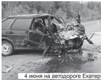
4 июня на автодороге Екатеринбург - Серов...

За период с 30 мая по 5 июня на территории Нижнетуринского городского округа зарегистрировано 10 дорожно-транспортных происшествий, в результате которых пострадали 4 человека.