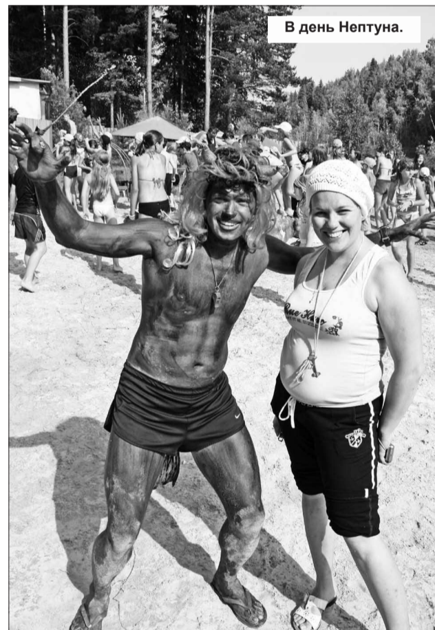
В день Нептуна.