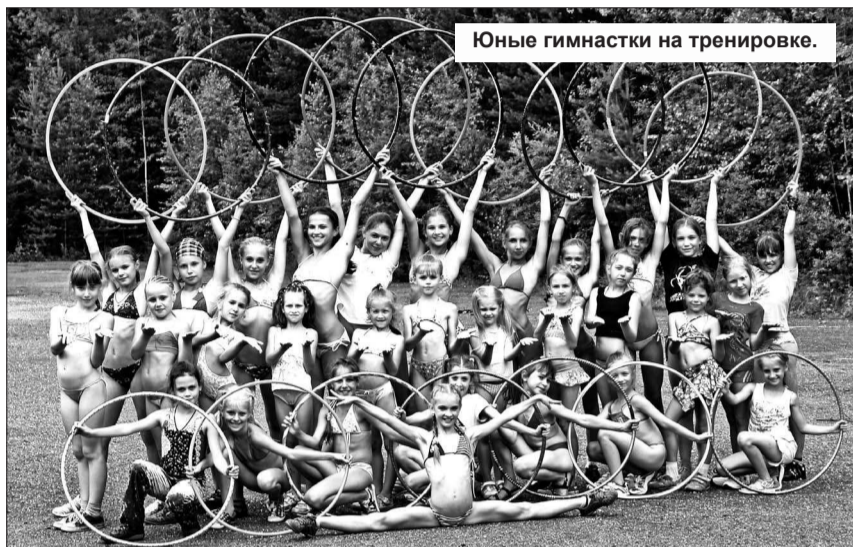
Юные гимнастки на тренировке.

Во вторник закончилась вторая смена в детском оздоровительном лагере «Ельничный». И, как всегда, дети не хотели покидать его. Они надолго запомнят своих воспитателей, вожатых и эти счастливые летние деньки. В прошедшую смену в лагере отдохнули 192 ребенка, в том числе отряд девочек-гимнасток, которые были частью дружного коллектива, принимали активное участие в мероприятиях, но не забывали и тренироваться.