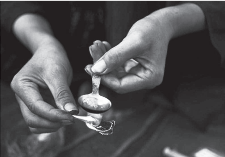
Ты уничтожен, уже не живешь. Темень, обман и ужасная ложь. Думаешь ты, что ты в мире один И что лучший твой друг – дезоморфин!

«Крокодил» – второй по популярности наркотик в России после героина. Многие скажут: «Нас это не касается!» И будут не правы. Опасность дезоморфина для наркомана в том, что он не оставляет ему ни единого шанса на выживание.