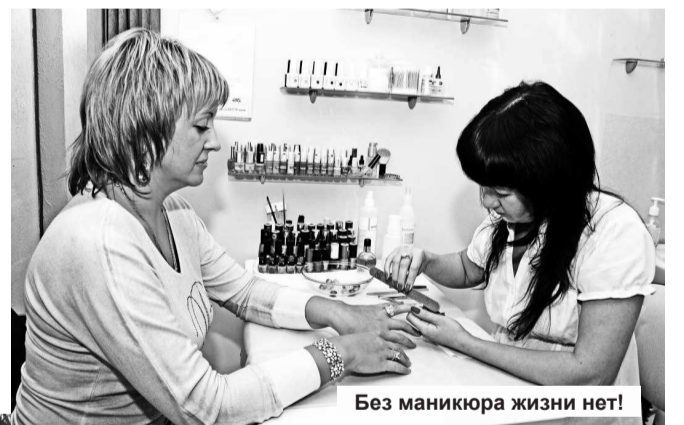
Без маникюра жизни нет!