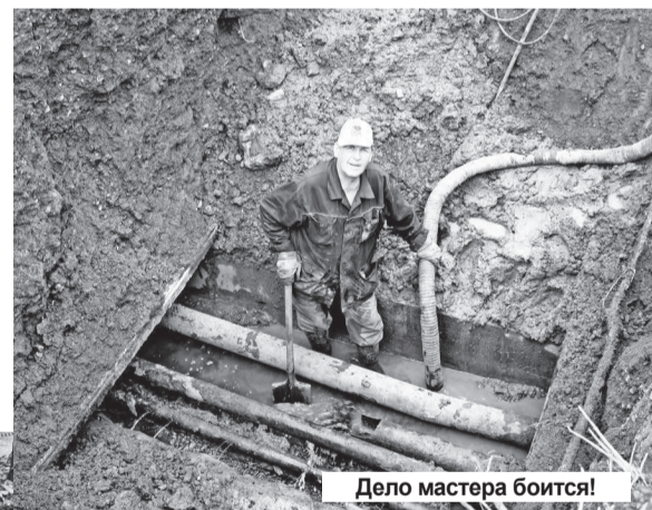
Дело мастера боится!