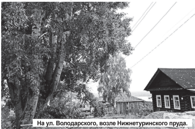
На ул. Володарского, возле Нижнетуринского пруда.

Множество старых тополей являются угрозой здоровью и имуществу нижегородцев. В других городах нашей страны тополя падают на «лексусы» и даже убивают людей. В 2009 в Петропавловске старое дерево рухнуло на коляску с семимесячным ребенком (мама не успела своевременно отойти). Ребенок был доставлен в больницу с черепно-мозговой травмой. Каждая буря несет в себе опасность, потому как даже относительно слабый ветер срывает со старых тополей большие ветки, а сильный может уронить и все дерево. Видеозаписи падения деревьев в различных уголках России выложены на YouTube, случаи падения тополей на территории Нижней Туры зафиксированы видеоредами сотовых телефонов нижегородцев. И такие случаи не редкость. Так представляют ли старые тополя угрозу, что с ними надо делать?