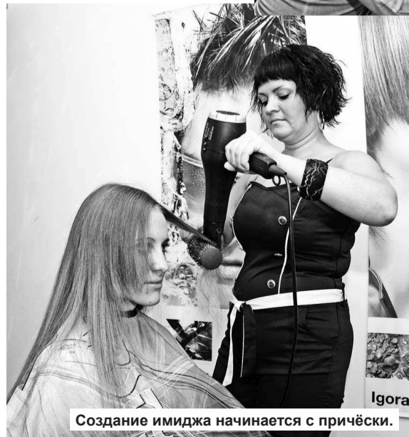
Создание имиджа начинается с причёски.

сделать так, чтобы вы восхитительно выглядели.