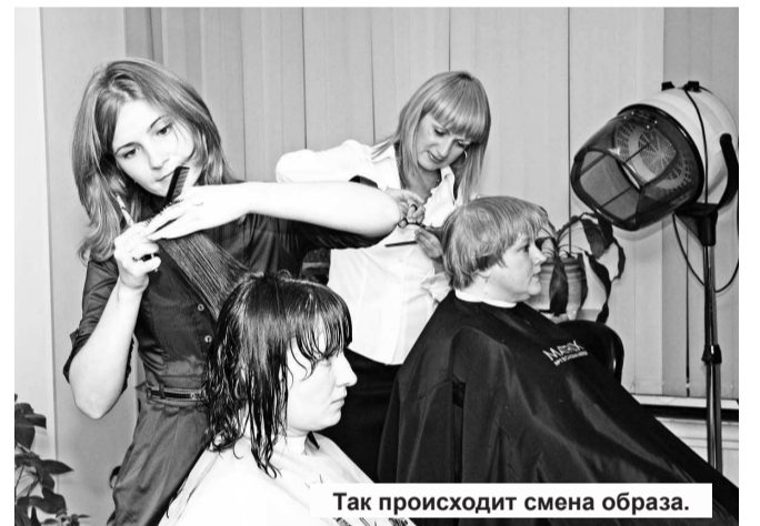
Так происходит смена образа.