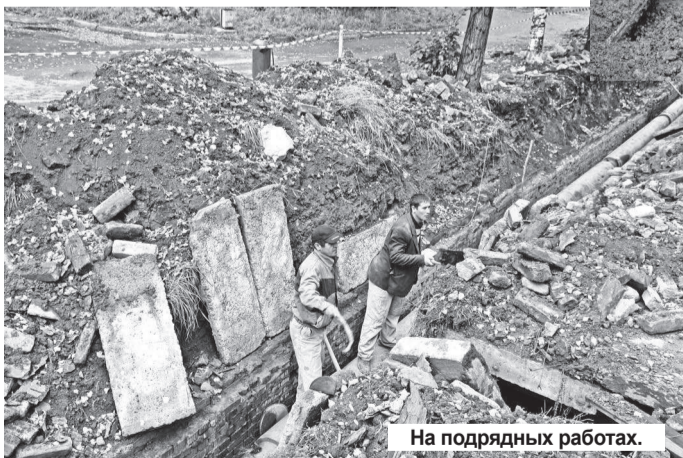
На подрядных работах.

ставки. Вопросы с управляющими компаниями в этом году решаются без больших проблем, с учетом опыта прошлых лет. Вот только с ЗАО «СТЭК» дела обстоят похуже. В настоящее время подписано дополнительное соглашение в отношении многоквартирных жилых домов, которые находятся в управлении ЗАО «СТЭК», о том, что с 1 августа ООО «СТК» переходит на прямые расчеты с нанимателями и собственниками жилых помещений. ЗАО «СТЭК» будет получать плату за свои услуги, поставщик тепловой энер-