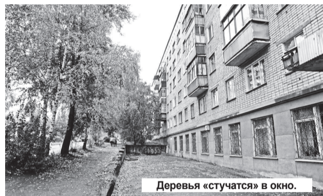
Дерева «стучатся» в окно.