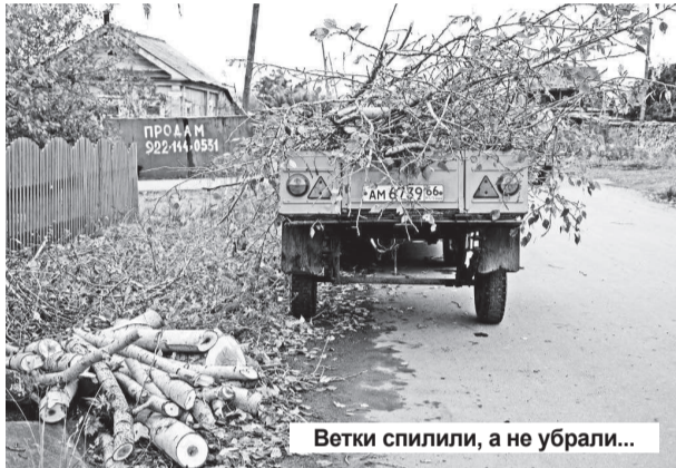
Ветки спилили, а не убрали...

но дерево она составляет в среднем около 10 тысяч рублей. И поэтому убирают деревья, руководствуясь следующими параметрами: наклон свыше 15%, высокая парусность, подверженность корневой гнили, которой не видно снаружи. Дерево спиливают не целиком, а частями (для этого нужна специальная вышка). Помимо того что дерево нужно раскрывать, его еще и вывезти необходимо. Затраты включают в