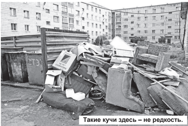
Такие кучи здесь – не редкость.