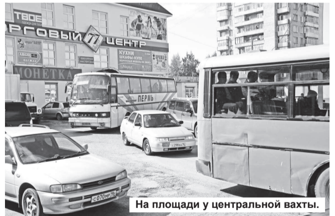
На площади у центральной вахты.

При строительстве нового торгового центра из красного кирпича была разрушена дорога, ведущая в нашу редакцию. Отдел архитектуры города, который, кстати, и выдавал разрешение на его строительство, считает, что разрушенная дорога находится на территории муниципалитета и восстанавливаться за счет хозяина этой торговой точки не должна. Так кто же и на какие средства обязан восстанавливать разрушенную при строительстве дорогу?