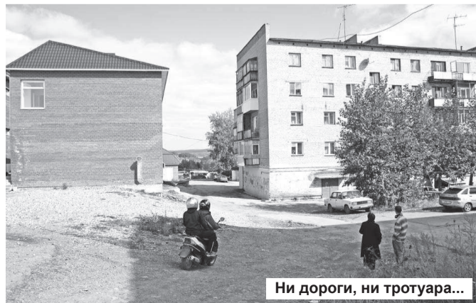
Ни дороги, ни тротуара...