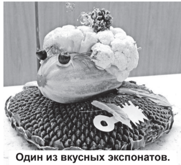
Один из вкусных экспонатов.

Рядом с заводской столовой на нескольких столах разместились довольно интересные, забавные, веселые и грустные «зверюшки», фрагменты леса и просто предметы повседневного пользования. Оценка участников конкурса проводилась в пяти номинациях. Призы за лучшее художественное оформление получили коллективы отдела главного конструктора (ОГТ), заготовительного цеха и отдела главного технолога (ОГТ), их композиции «Осеннее чаепитие», «Сказочный пенек» и «Черепашка Наташка». Коллектив ОГТ также был на высоте в номинации «Смешной и грустный овощ» наряду с коллективом инструментального участка. Заготовительный цех получил приз и зрительских симпатий, и был лучшим в «Оригинальном комментарии» с работой «Галерея огородника». Не остался без приза зрительских симпатий и коллектив ОГК.