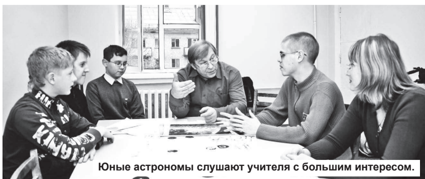
Юные астрономы слушают учителя с большим интересом.