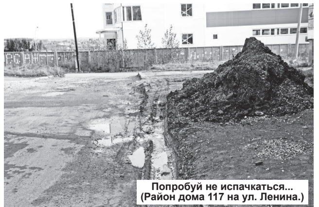
Попробуй не испачкаться... (Район дома 117 на ул. Ленина.)