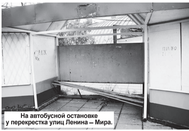
На автобусной остановке у перекрестка улиц Ленина – Мира.