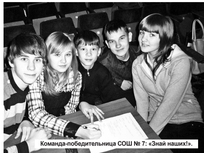
Команда-победительница СОШ № 7: «Знай наших!».