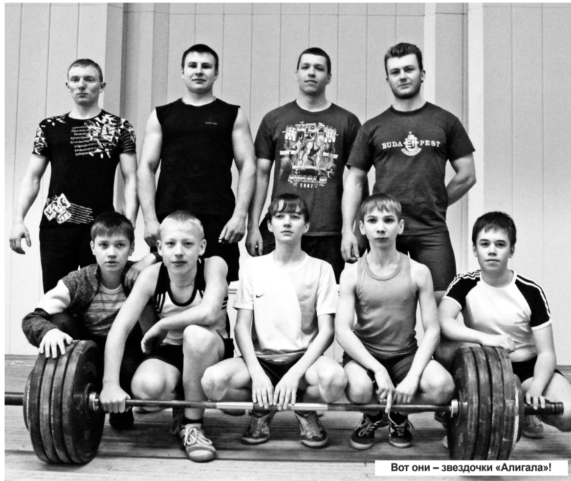
Вот они – звездочки «Алигала»!