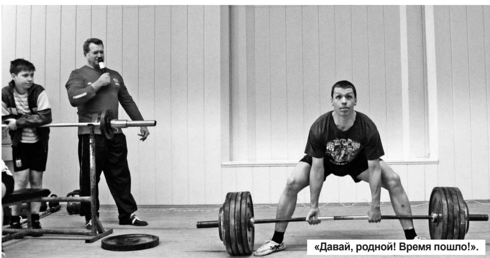
«Давай, родной! Время пошло!».