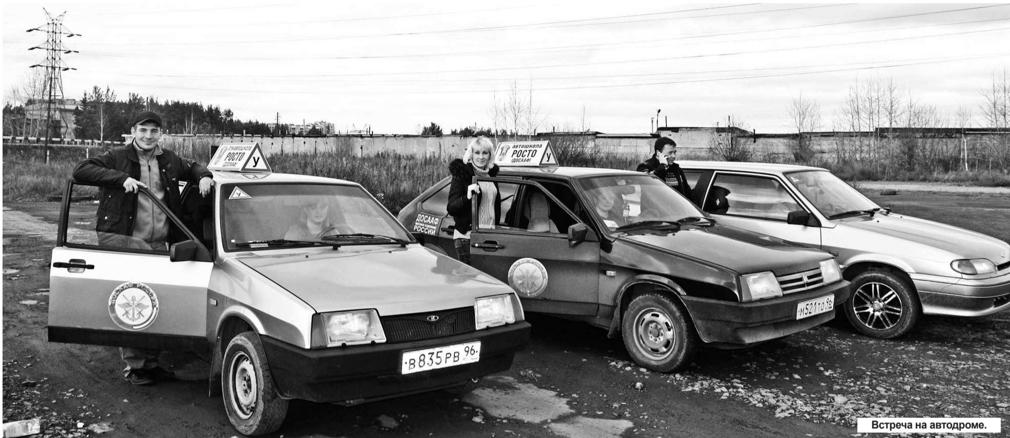
Встреча на автодроме.