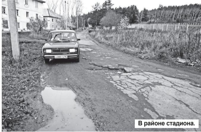
В районе стадиона.